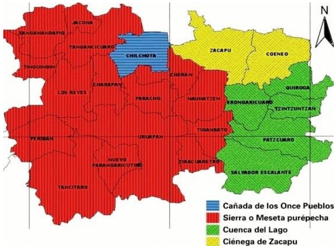
Mapa 1: Regiones p'urhépechas.

La localidad de Ichán está situada en el Municipio de Chilchota (en el Estado de Michoacán de Ocampo). Tiene 2931 habitantes. Ichán está a 1900 metros de altitud.