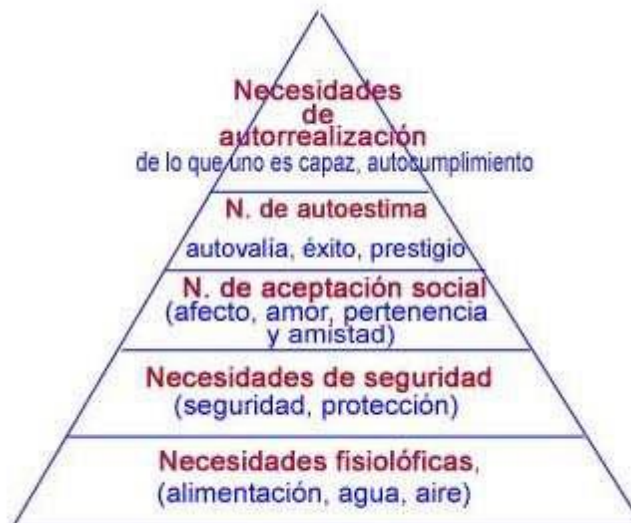
Figura 1. Pirámide o jerarquía de necesidades de Maslow (1943)

A la autorrealización, Maslow (1993), la define como la realización creciente de las potencialidades, capacidades y talentos; como cumplimiento de la misión o llamada, destino, vocación; como conocimiento y aceptación más plenos de la naturaleza intrínseca propia y como tendencia constante hacia la unidad, integración o sinergia, dentro de los límites de la misma persona.