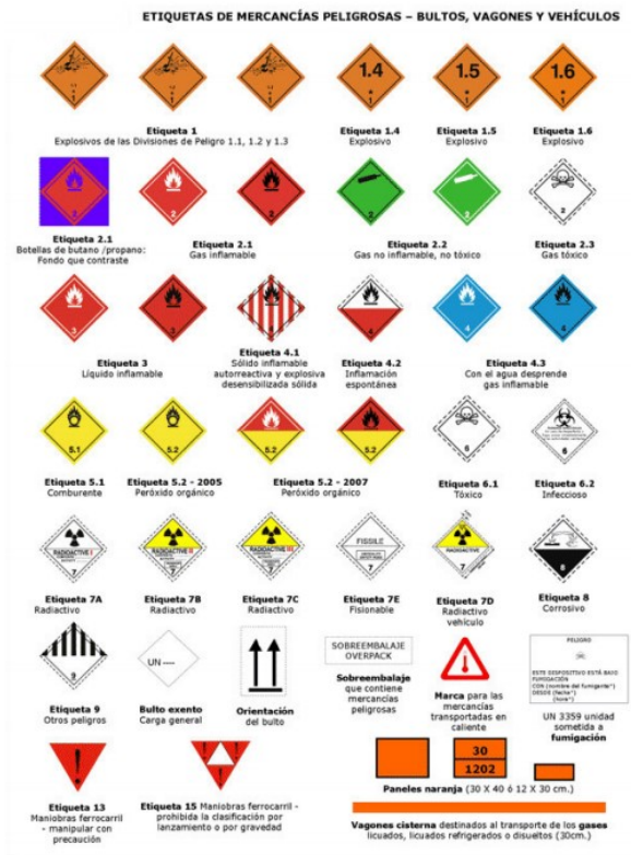
Fig. 3. Etiquetas para materiales peligrosos.