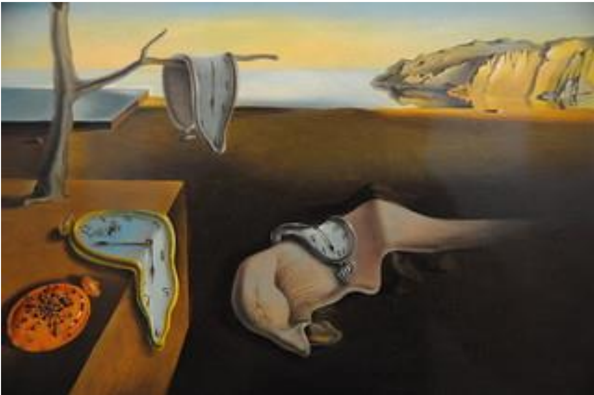
Figura 2: La imagen representa el tiempo en un paso de materia llamada fusión. La obra pictórica presentada nos sirve como referencia para reflexionar sobre el tiempo, ya reflexionado por Safranski y puesto en el contexto de la modernidad líquida de Zygmunt Bauman.

El hombre individual de nuestra contemporaneidad se ve inmerso en los principios de modernidad líquida que desarrolla Bauman en sus escritos. Esto ha de afectar en las ramas de educación, relación, trabajo, hogar, pensamiento, psique, etc. El factor tiempo, mostrado en los diferentes objetos de medición – mas no de retención de él – posibilitan la rapidez de la enajenación del hombre. El fenómeno de ser puntual ha servido para clasificar a los seres humanos. Ha potencializado las reglas, los desempleos, los despidos, los límites, la alienación. La gestión de éste lo experimentamos todos los días, pero obtener una consciencia