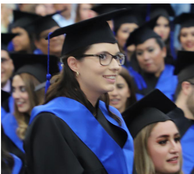
Abogada con 10 de promedio.