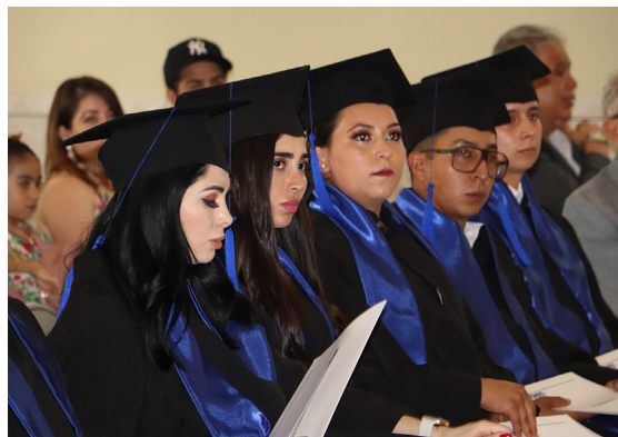
Los egresados escucharon atentos el acto.