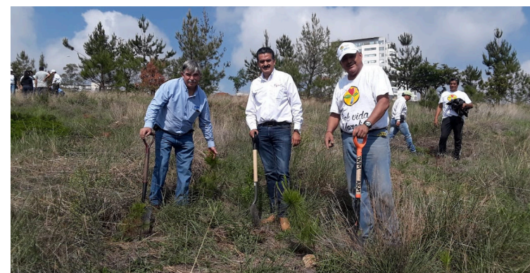
La comunidad UVAQ se suma a la reforestación.