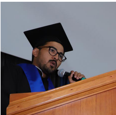
Dio el discurso final.

"Recibir la medalla es un gesto muy hermoso. Siento que no lo merezco, pero si la comunidad de la UVAQ así lo decidió, la acepto con mucho gusto. Esta Medalla Don Vasco es una inspiración para los que intentamos salir adelante a pesar de las dificultades, la medalla es como una caricia después de la muerte de mi Papá, la medalla es triunfo y gloria para Dios por medio de mi persona", dijo el egresado de Psicología y Filosofía.