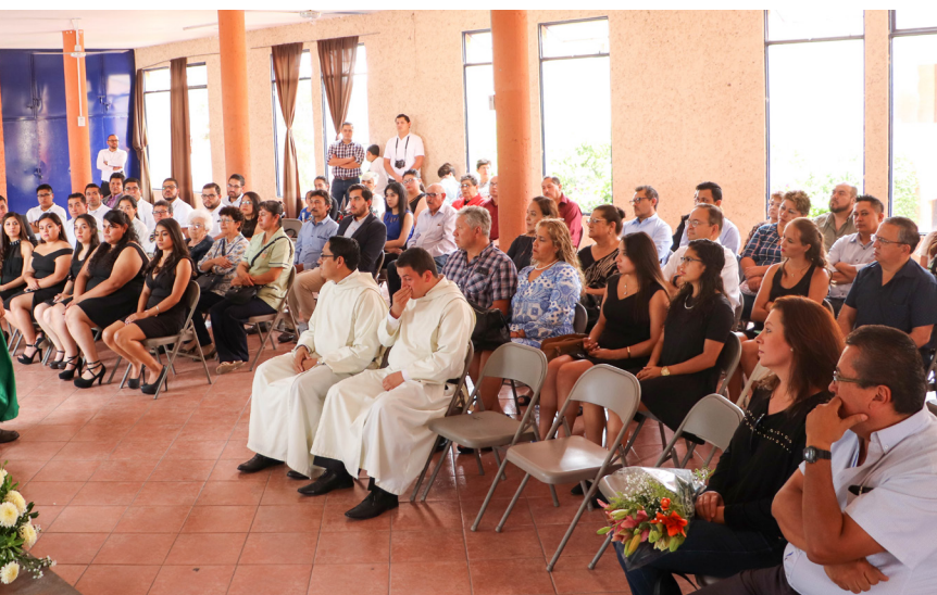
Dos seminaristas concluyeron con la Licenciatura en Filosofía.