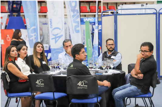
Los empresarios, atentos a la charla.