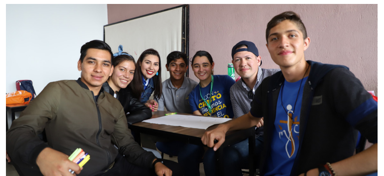
Los jóvenes también participaron en los talleres.