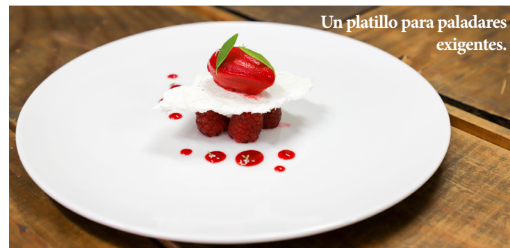
Un platillo para paladares exigentes.