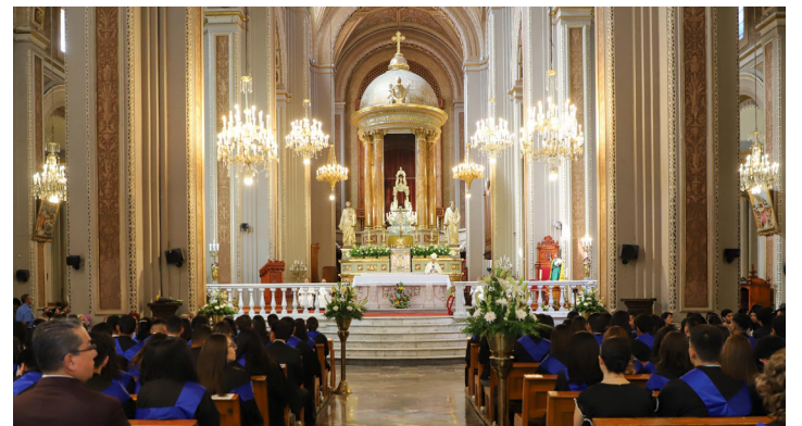
Hubo una gran asistencia de los familiares.