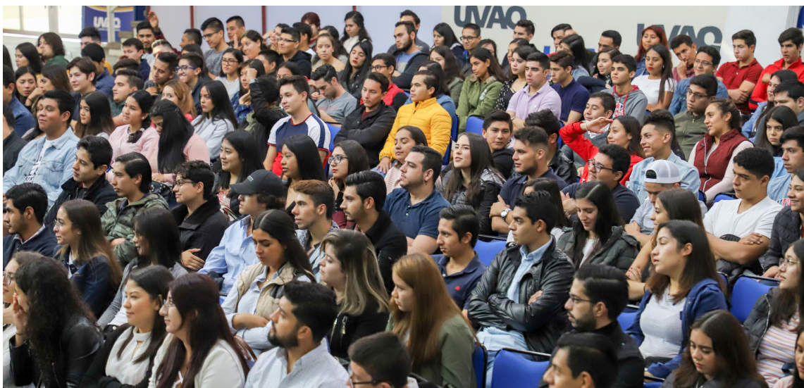
Estudiantes de Morelia y ciudades vecinas se integraron en un productivo curso.