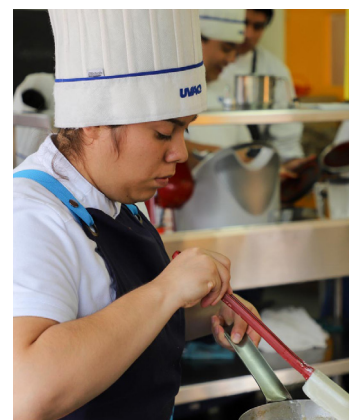
Hay muchos preparativos.