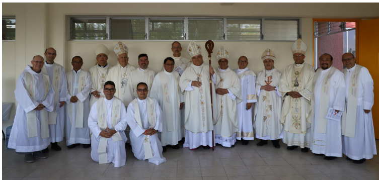
Obispos de todo el mundo acompañaron a los laicos.