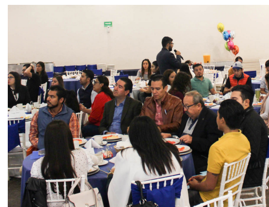
La variedad de posgrados se amplía.