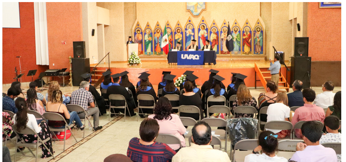
La UVAQ San Luis cumplió con un nuevo ciclo.