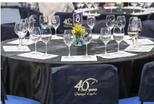
Se cuidaron todos los detalles para los invitados.