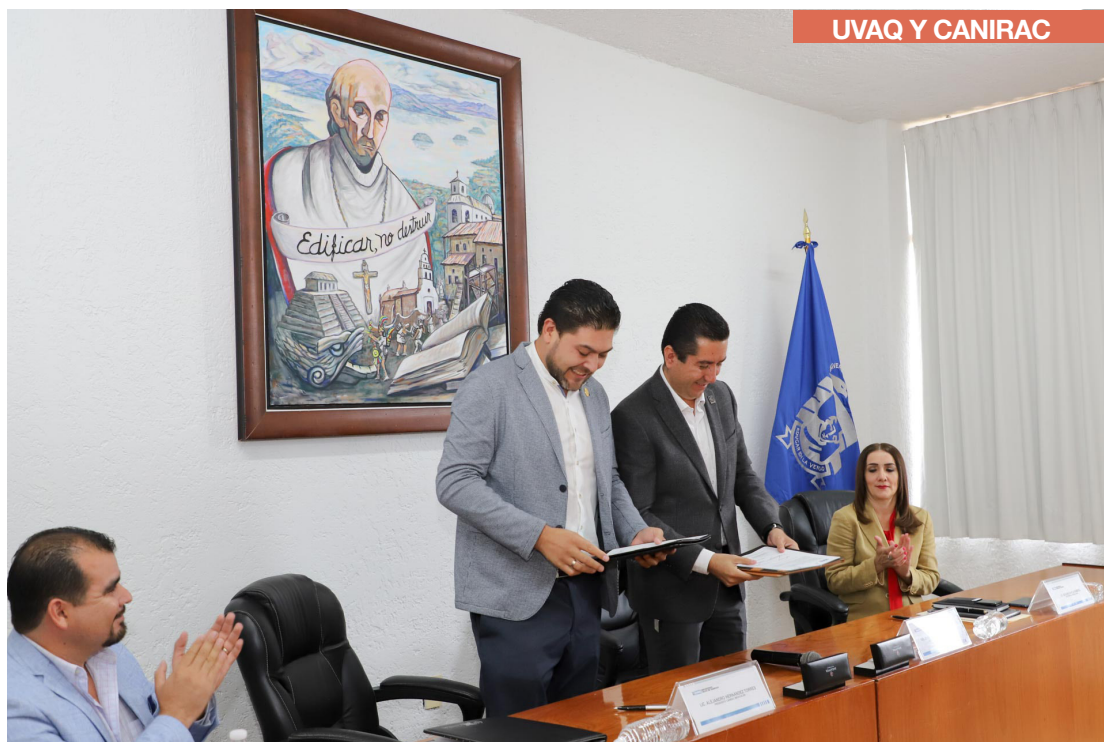
Directivos de la UVAQ y CANIRAC firman un convenio de colaboración.