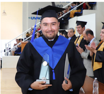
Ganador de la Medalla Don Vasco.

La ceremonia fue un reconocimiento al esfuerzo y dedicación de los egresados de la Secundaria y Preparatoria, luego de tres años de esfuerzo