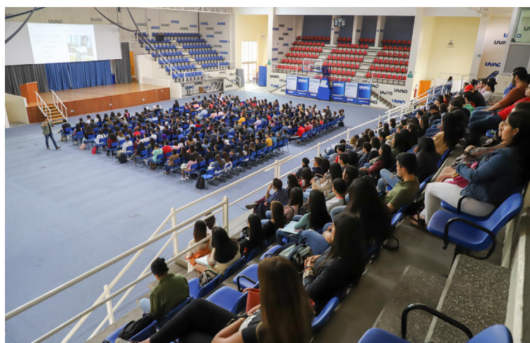
Se registró una gran asistencia al Curso de Inducción.

De acuerdo con el programa de actividades, los estudiantes de nuevo ingreso conocieron durante cuatro días en qué consisten los talleres culturales y deportivos, lo que ofrece el Departamento de Idiomas, Movilidad Estudiantil y Pastoral, además de Grupos Universitarios y otros.