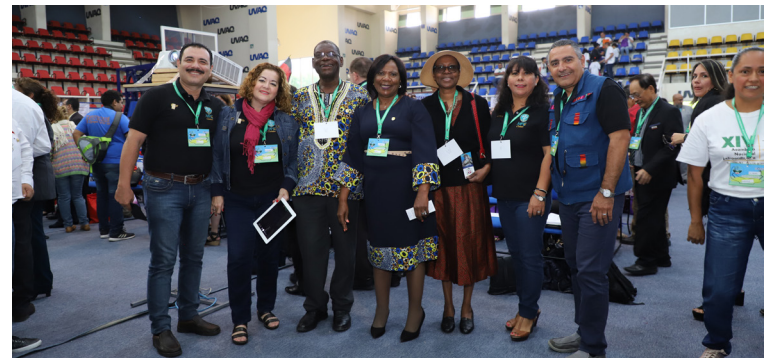
Sin importar las diferencias culturales, los matrimonios convivieron en Morelia.

Durante el sábado 13 y domingo 14 se desarrollaron los talleres y conferencias de la asamblea, que incluyó la participación de grupos juveniles.