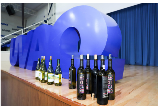
Fue una gran noche de vinos y negocios.