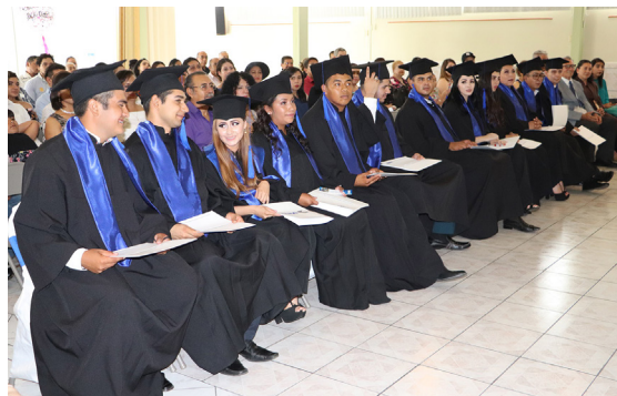
Recibieron sus constancias de fin de cursos.