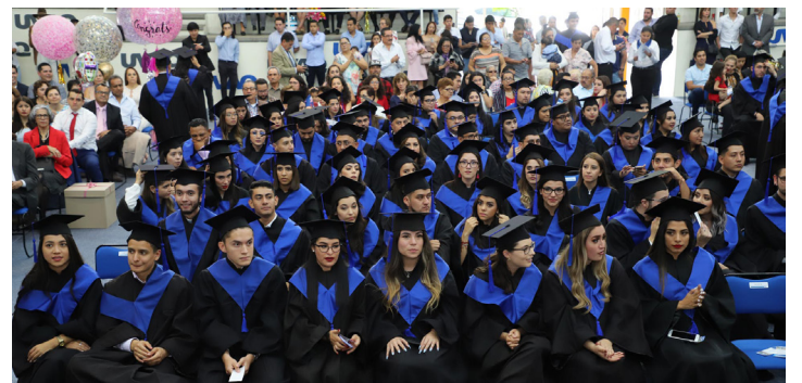
Las autoridades académicas encabezaron el evento.