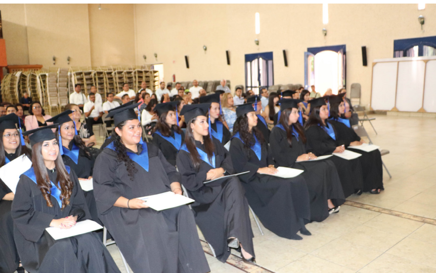
Las recién egresadas lucieron motivadas.