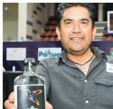
Mostraron sus obsequios.