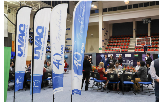
El auditorio fue la sede del evento.