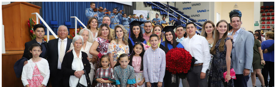
Familias enteras acompañan a sus nuevos profesionistas en uno de los momentos más simbólicos de su vida.

La graduación del pasado viernes 19 de julio se celebró en el Campus Santa María, donde se reconoció a los egresados con me-