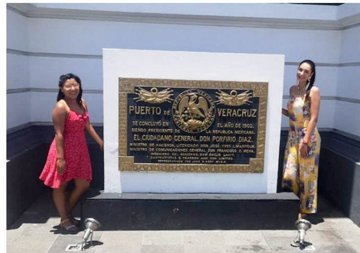
Dos de las estudiantes que colaboraron en la Aduana de Veracruz.