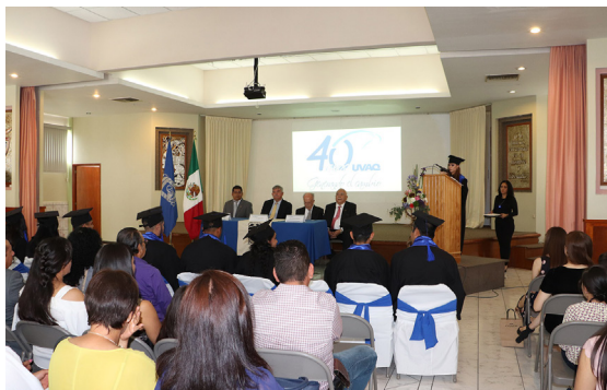
Fue una ceremonia muy especial.

La Unidad Académica de la UVAQ en Zamora celebró la graduación de 12 estudiantes en Ingeniería en Innovación y Tecnología Agrícola