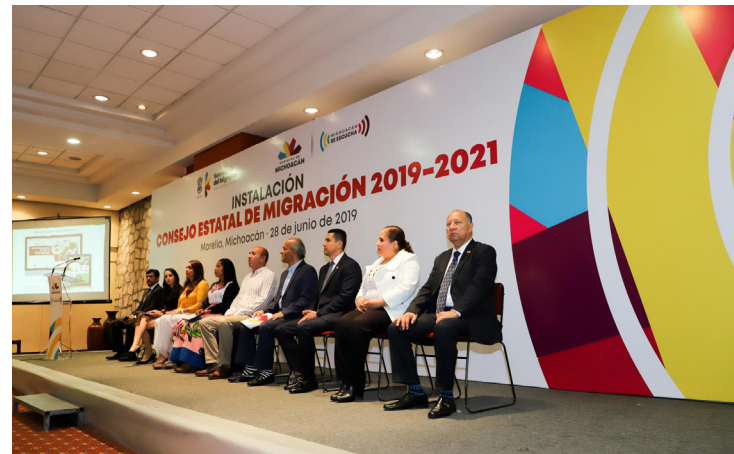
La Universidad se suma a los esfuerzos del Gobierno del Estado.

“Un gusto que la UVAQ pueda acompañar al Gobierno del Estado de Michoacán en iniciativas que defiendan y reunifiquen las familias michoacanas”, concluyó el Rector.