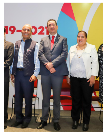
El Secretario del Migrante, el Rector y la Presidente de la Junta de Gobierno de la UVAQ.

Este órgano colegiado de participación, es único en su tipo y brindará asesoría, consulta y evaluación para el diseño, elaboración, difusión e implementación de políticas públicas en favor de los migrantes y sus familias.