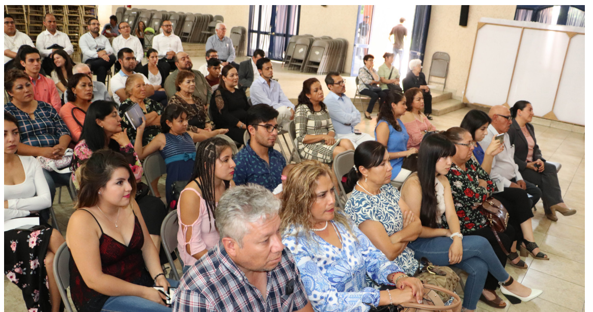
Los familiares acompañaron a los egresados.