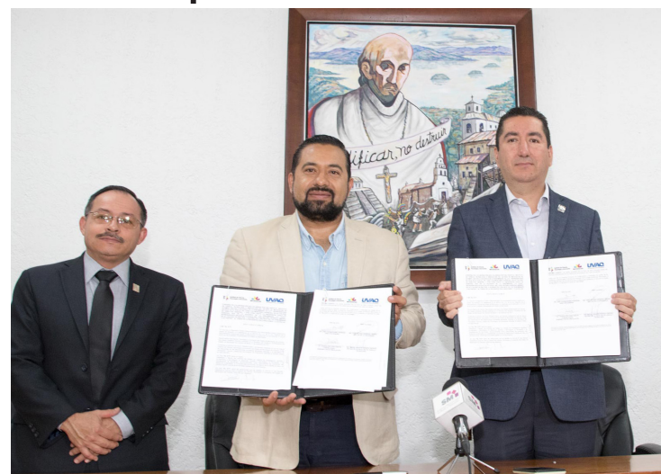
Con la firma del convenio se preparan varios eventos y proyectos.

Con este convenio se buscarán becas a doctorados en el extranjero, incorporación