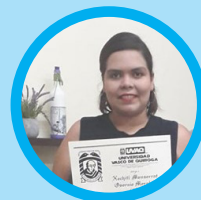
Xóchitl Osornio Gastronomía