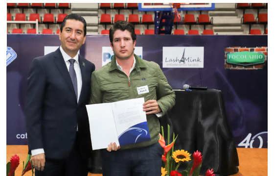
El Rector de la UVAQ entregó becas de posgrado.