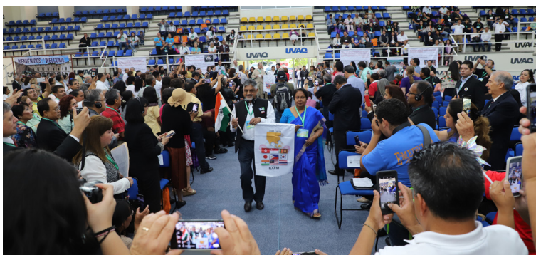
Líderes de todo el mundo desfilaron en el Auditorio César Nava.

La UVAQ recibió la XIV Asamblea Mundial de las Familias ICCFM con representantes de 23 países