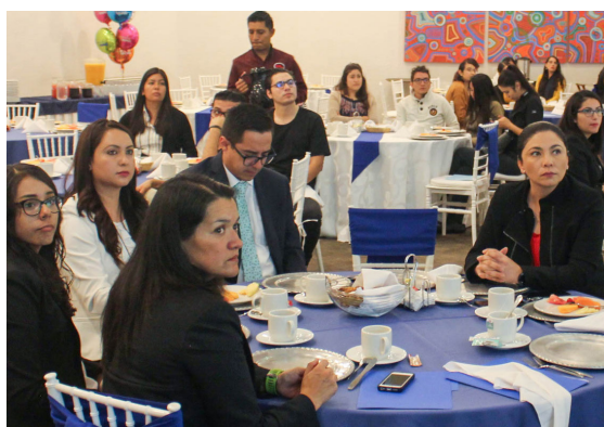
Coordinadores de diferentes maestrías.