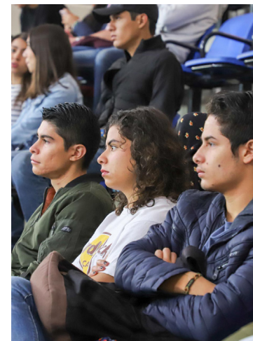
La mayoría de los universitarios vienen de fuera de Morelia.

Además, con cada materia de Filosofía se desarrollan talleres y charlas de formación que complementan el seguimiento al universitario para que sepa desde finanzas personales, hasta preparar comida balanceada, manejo de su tiempo libre, vida social y desarrollo espiritual.