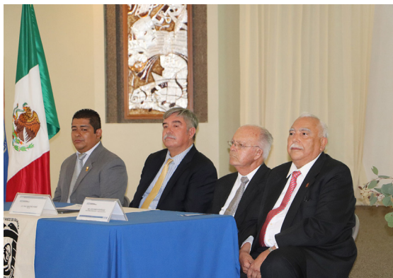
Autoridades académicas encabezaron la ceremonia.