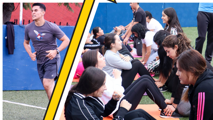
Chicas súper poderosas.