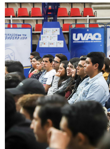
Todos llegan con sueño: ser profesionistas de éxito.