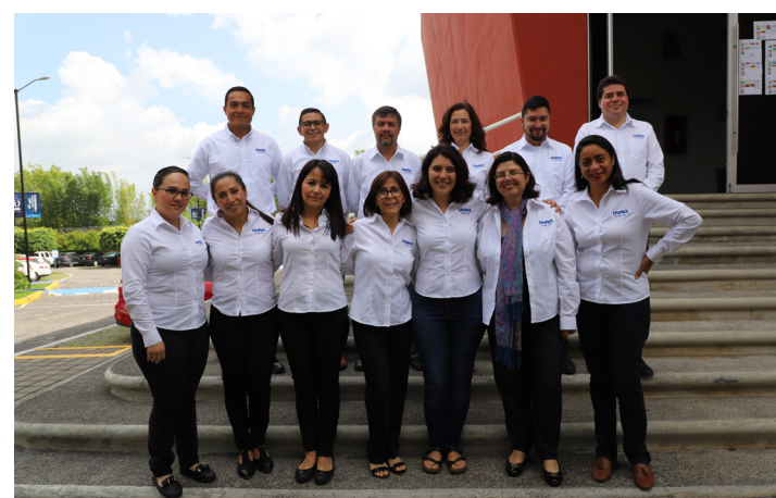
Algunos de los tutores del PAP.