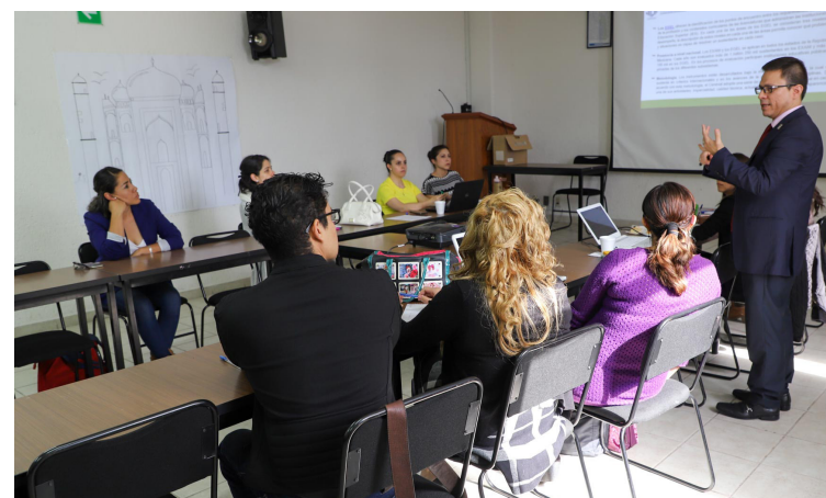
Los profesores de Nutrición están en constante capacitación.