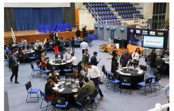
Los profesionistas asistieron al desayuno informativo.