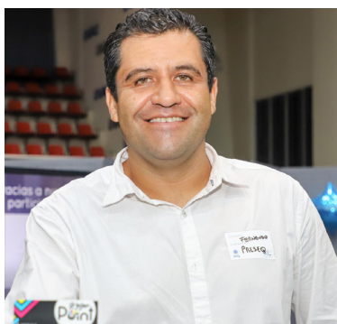
Los asistentes se llevaron regalos.