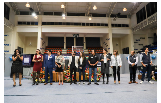
Los patrocinadores se presentaron al final.