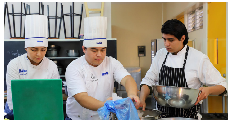
Estudiantes de Gastronomía en la UVAQ preparan postres franceses.

Tras casi dos horas de trabajo, los futuros chefs de la UVAQ se mostraron satisfechos de los resultados, porque aprendieron cómo se prepara cada componente del platillo y además de obtener un postre lleno de sabores, le dieron su toque.