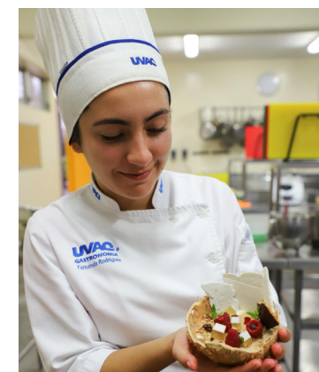
El postre final, reinventado.