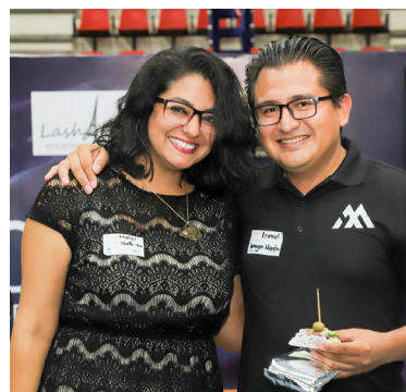
Regalos para todos.