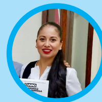
Alma Retana Gestión Empresarial