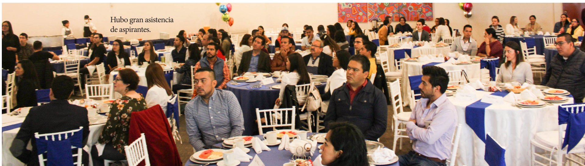
Hubo gran asistencia de aspirantes.