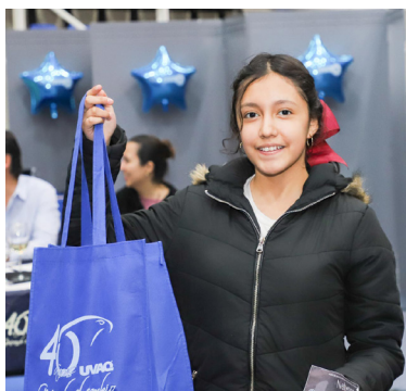
Hubo empresarios muy jóvenes.