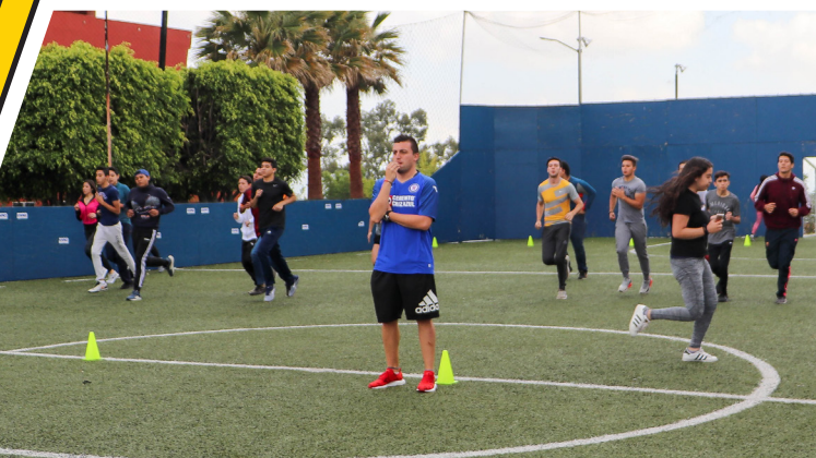
Los evaluadores estuvieron atentos a cada detalle.