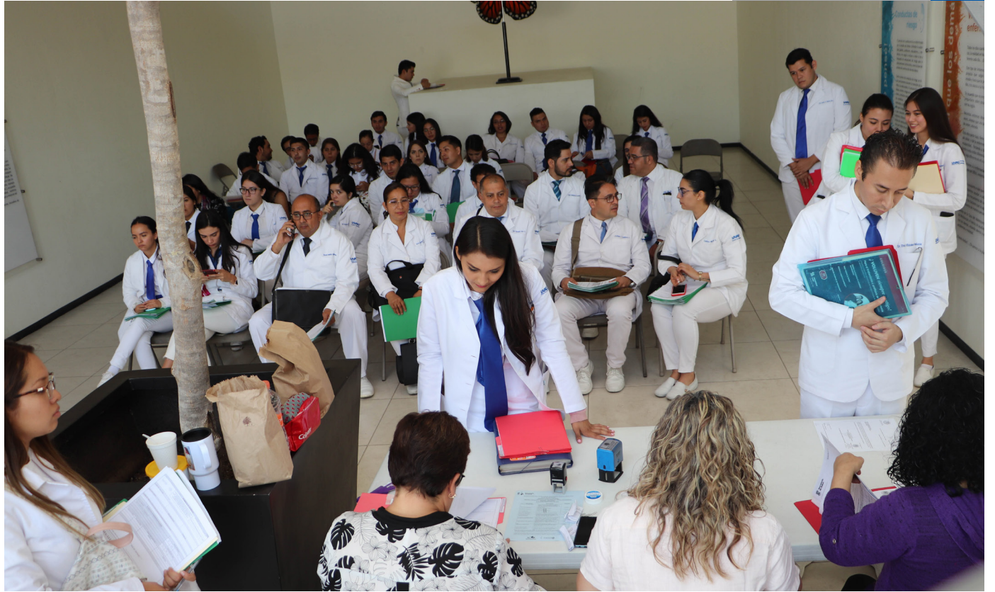
De acuerdo con su promedio, los muchachos eligen dónde darán su servicio social.