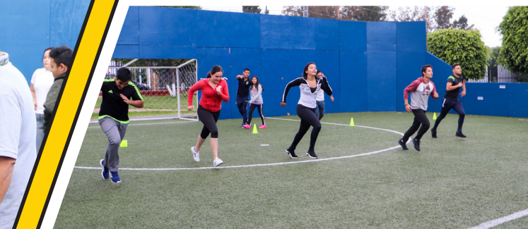
Se evaluó fuerza, resistencia y otras habilidades.