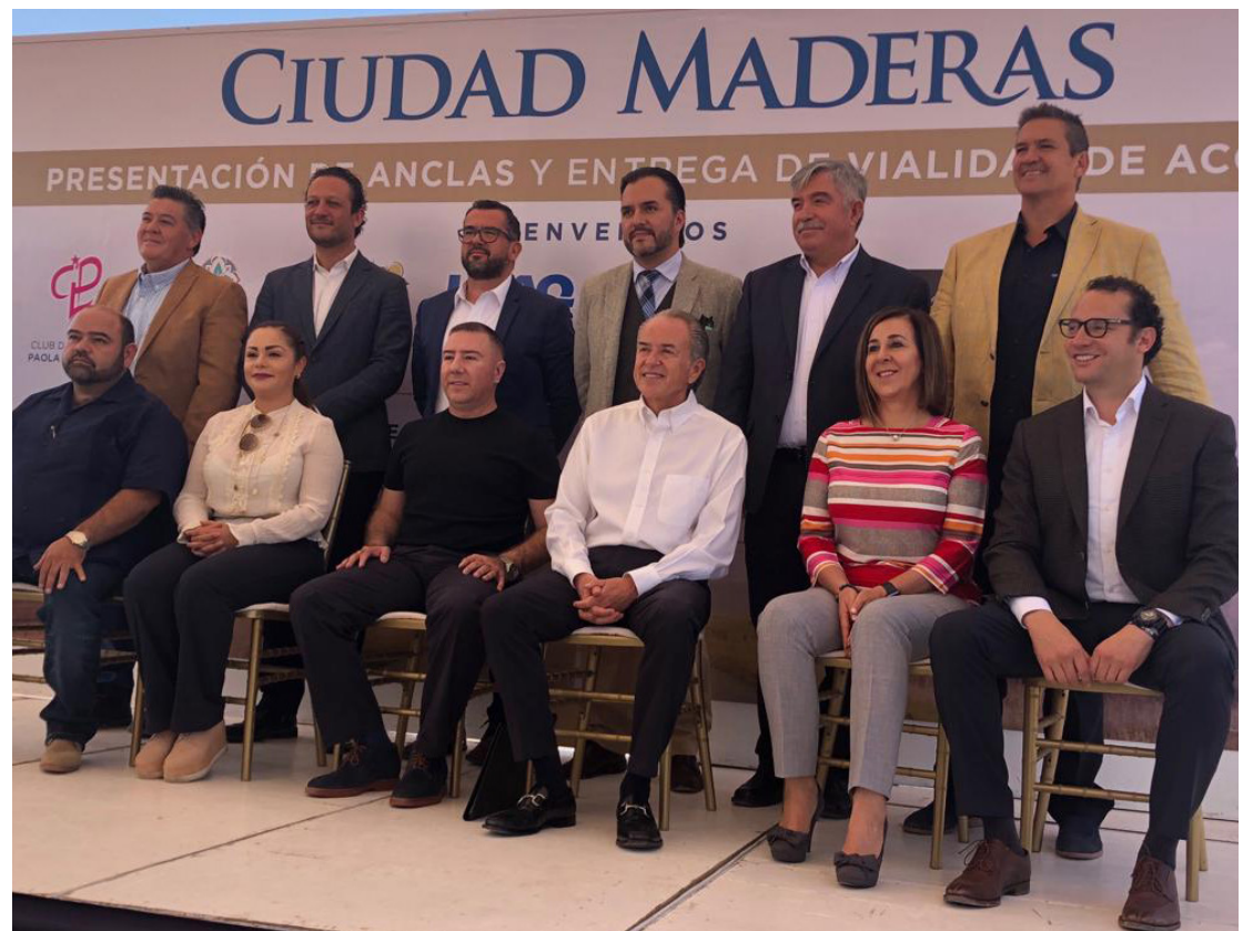
Los directivos presentaron los avances del complejo potosino.