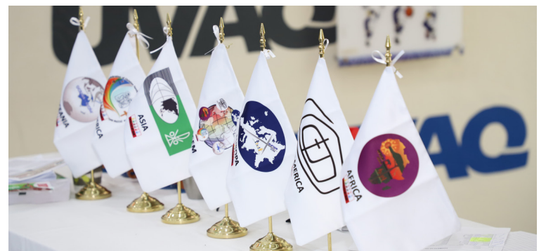
Agrupaciones de diferentes continentes estuvieron representadas.