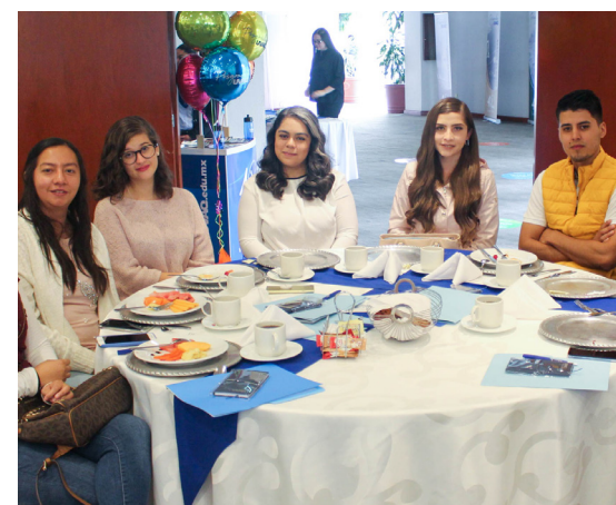
Los profesionistas asistieron al desayuno informativo.

Y como nuevas ofertas, las maestrías en Ciencias de la Cultura Física, Ciencia de Datos, Cocina de Vanguardia y Alta Gerencia, Desarrollo y Transformación de los Negocios en la era Digital, Imagen Pública y Comunicación Estratégica, Juicio de Amparo y Nutrición Aplicada a las Ciencias del Deporte.