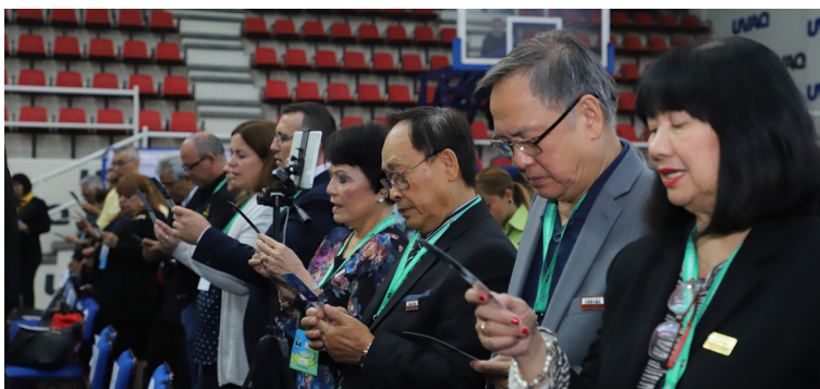
El Movimiento Familiar católico ha llegado hasta Asia.