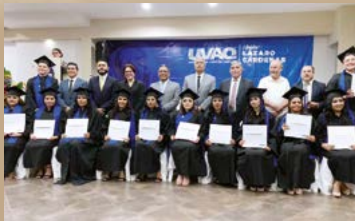
Autoridades escolares y civiles acompañaron a los egresados.

Ya se planean nuevas carreras en la UVAQ Lázaro Cárdenas como Ingeniería en Logística, Ingeniería Industrial, Desarrollo Sustentable, Ingeniería en Energías Renovables, entre otras, además de las maestrías en Juicios Orales, Educación Superior, Gestión Empresarial, Mercadotecnia y Maestría en Redes, entre otras propuestas.