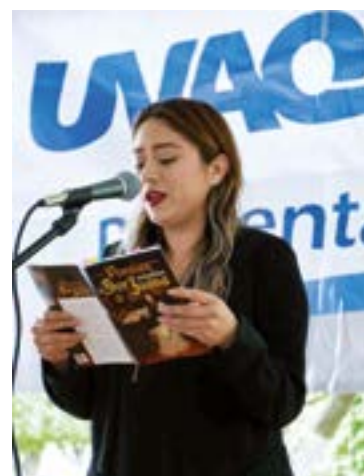
La poesía es otra de las alternativas artísticas en la UVAQ.