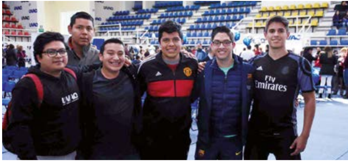
En la UVAQ se forman agentes de cambio en beneficio de la sociedad.