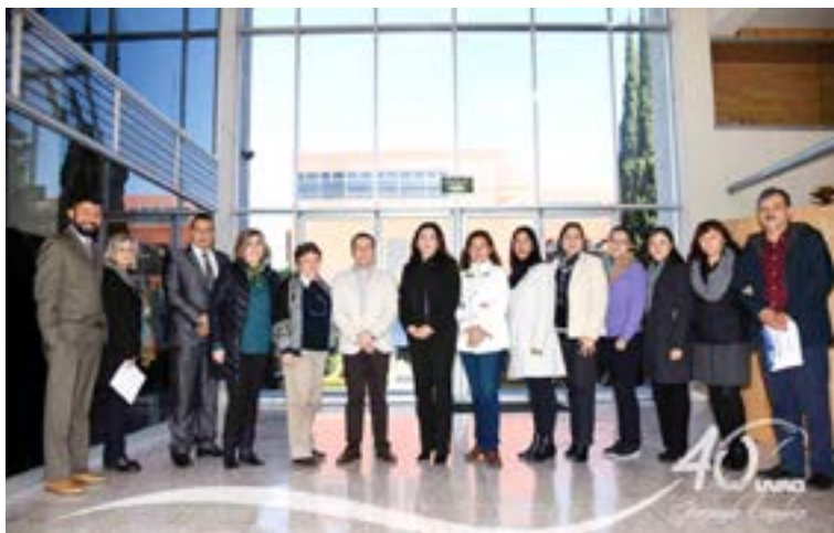
Coordinadores de diferentes posgrados que ofrece la UVAQ.

La UVAQ ofrece maestrías en: Administración, Nuevo Sistema de Justicia, Calidad de la Educación, Ciencia Política, Ciencias de la Computación, Comunicación, Derecho Procesal, Diseño Estratégico, Psicoterapia Familiar, Psicoterapia Psicoanalítica y Filosofía Aplicada, entre otras.