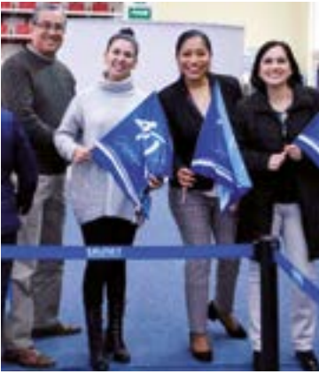
Los docentes, bien integrados.