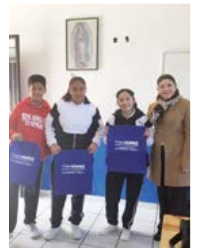
Alumnos del Instituto Luis Guerrero Esparza de Santa Clara del Cobre visitaron, el mes pasado la Unidad Académica de Pátzcuaro.