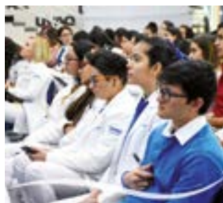
Todos muy atentos.