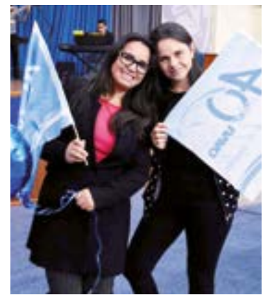
Se integran diversas áreas.