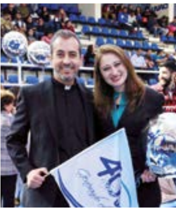
Se dio el 'banderazo' a los festejos.