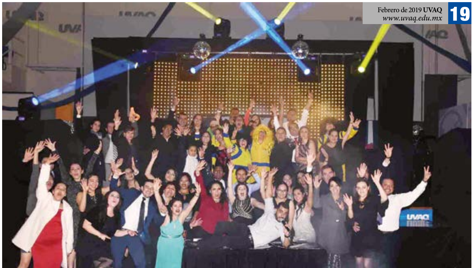
Gran ambiente se vivió en la cena de fin de año en el Campus Santa María.

Hubo premios especiales para los que cumplieron años de labor en la UVAQ, desde una pluma especial, hasta un pin de oro, monedas de plata grabadas y relojes