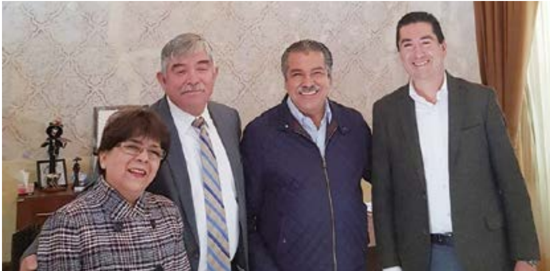
El Presidente Municipal de Morelia charló con los directivos de la UVAQ.