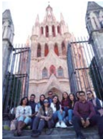
De viajar también se aprende.