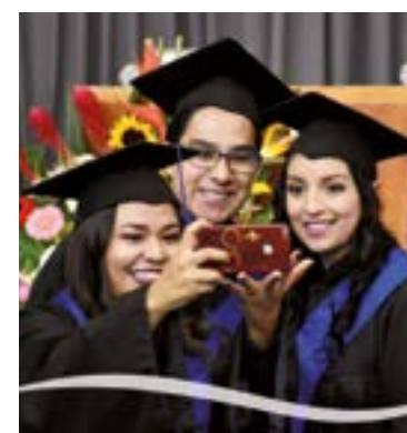
Las fotos del recuerdo no podían faltar en esta ocasión tan especial.