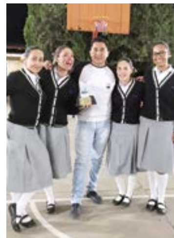
Felicidades a la escolta Halcones UVAQ Pátzcuaro por el Segundo lugar en Concurso Estatal Michoacán organizado por FEMEXBAM.