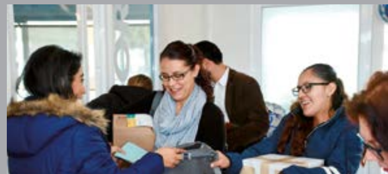
Al final se entregaron mochilas y otros recuerdos.

68 programas educativos están registrados en unidades de la UVAQ