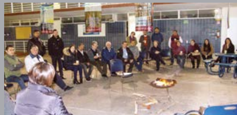
Durante la fogata se compartió la historia de cada unidad.