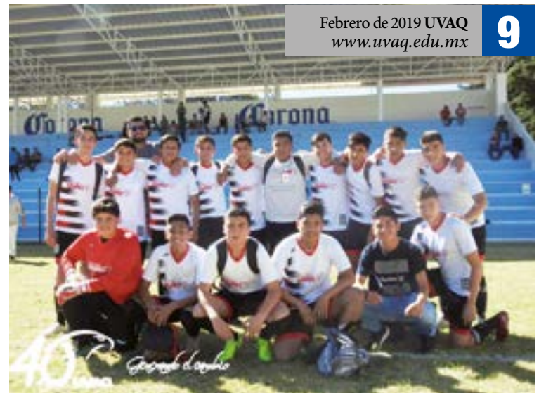
Más de 300 estudiantes se integran en la Prepa de UVAQ Pátzcuaro, que tiene una intensa actividad deportiva.

"La UVAQ ha tenido una gran aceptación por parte de la sociedad y alumnos, que creo que se ve reflejado en matrícula, en las ganas de estudiar con nosotros la prepa y las licenciaturas ejecutivas y con el ánimo de proyectar la obra de Don Vasco, sus valores y sus principios".