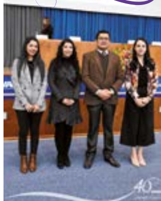
Algunos de los expositores.