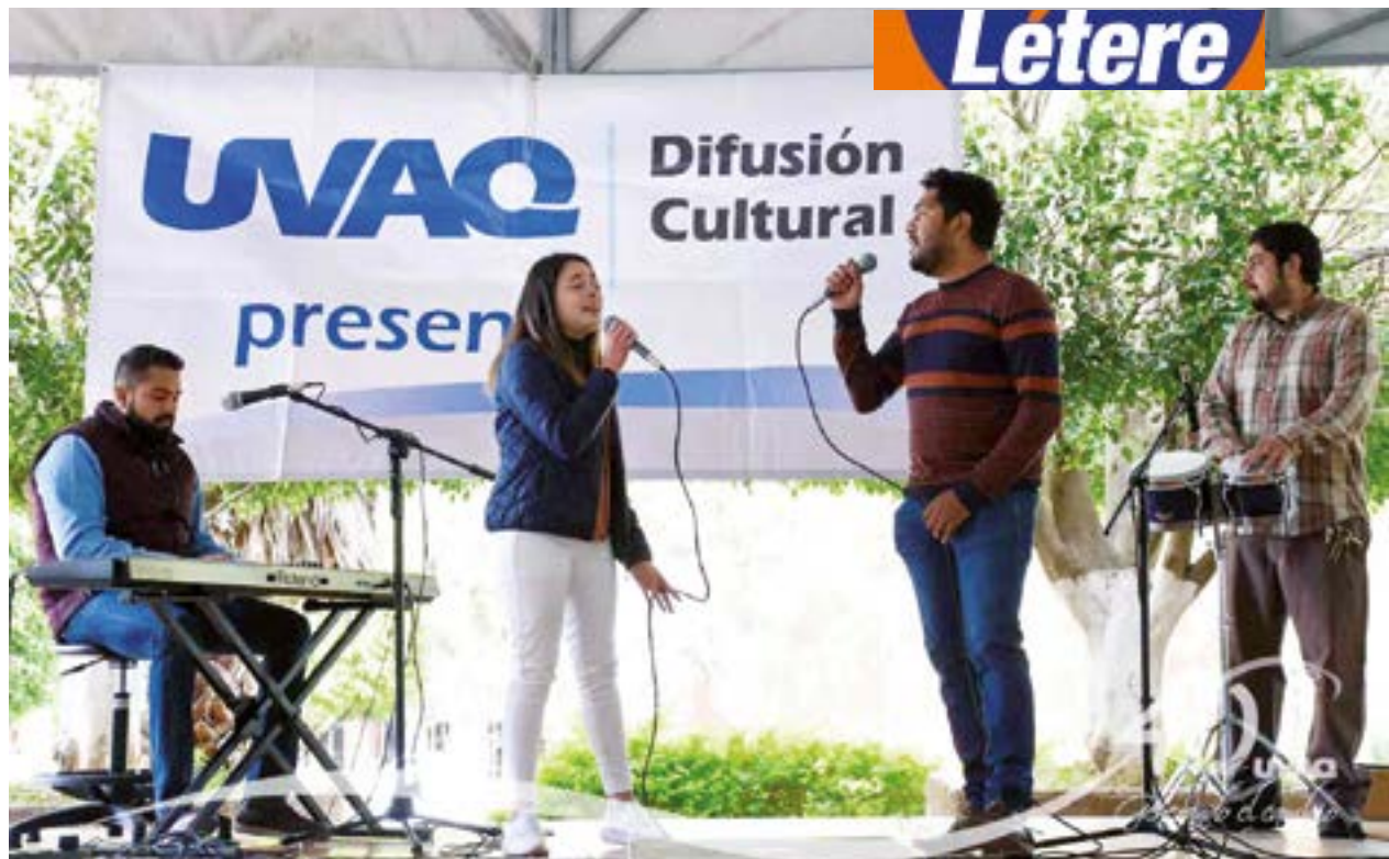
Estudiantes de diversas carreras ofrecieron un festival cultural.

Periodos de registro Enero y Febrero de 2019