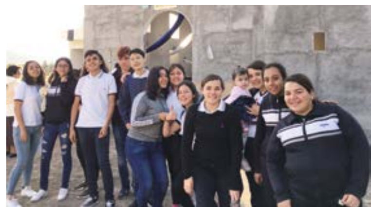
Los jóvenes de la UVAQ mostraron su energía y fervor en Quiroga.