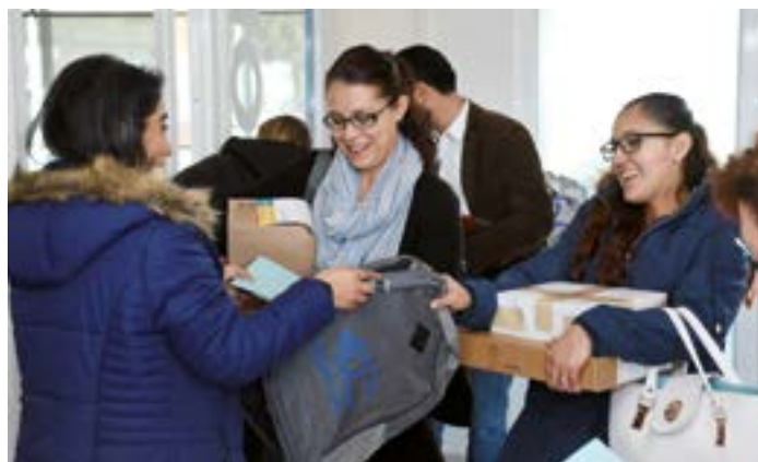
Las compañeras de Irapuato se llevaron algunos obsequios tras dos días de actividades en la Unidad Tres Marías.

“Trabajamos en Chicago y tenemos una sede en Waukegan, (Illinois, EU), donde tenemos clases que son híbridas (presenciales y a distancia) y empezamos a trabajar con aso-