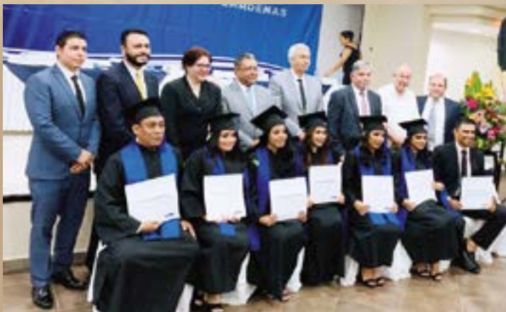
Los profesionistas mostraron su constancia de fin de cursos.

Egresan nuevos Licenciados en Comercio Internacional de la UVAQ, listos para aportar al impulso comercial y social de su entorno