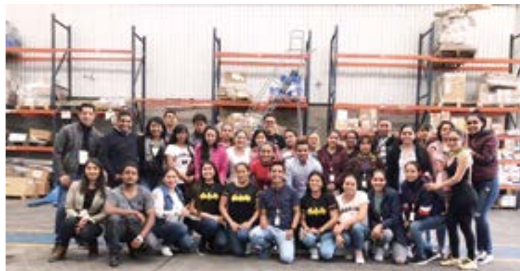
Estudiantes de varias carreras viajaron por Querétaro y Guanajuato.

"Vamos a ampliar la oferta según lo que nos digan los coordinadores, aparentemente por ahí venía Contabilidad, que es una carrera muy esperada por muchos jóvenes de la región".