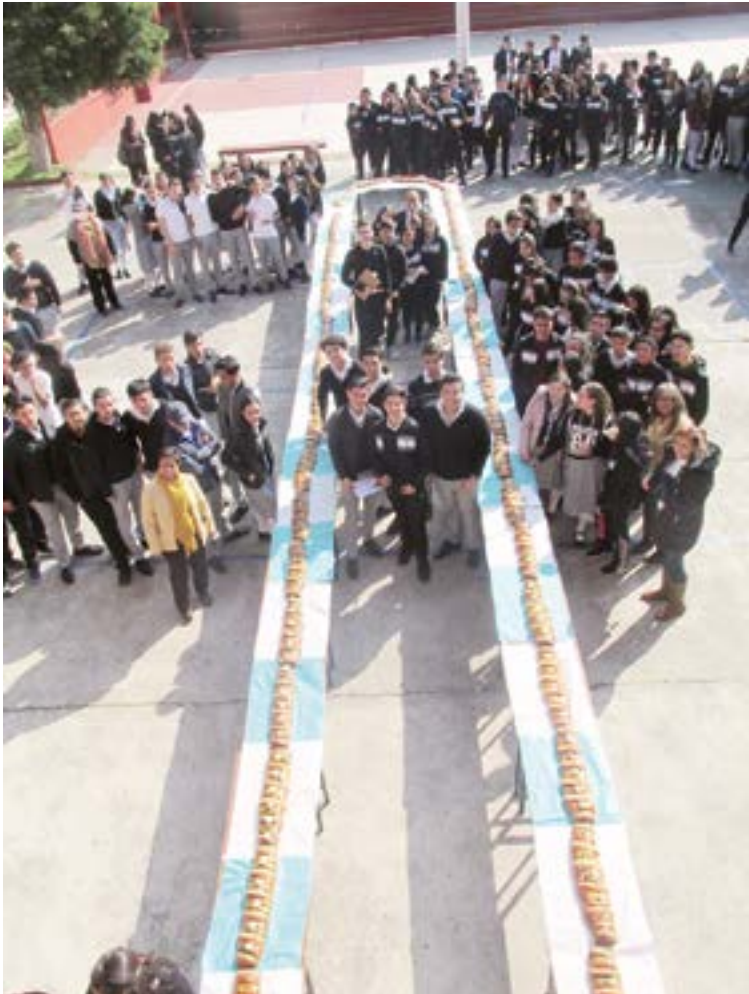
Más de 600 estudiantes de prepa y licenciatura asistieron a la Unidad San José, de Ciudad Hidalgo, donde se disfrutó de una gran Rosca de Reyes.