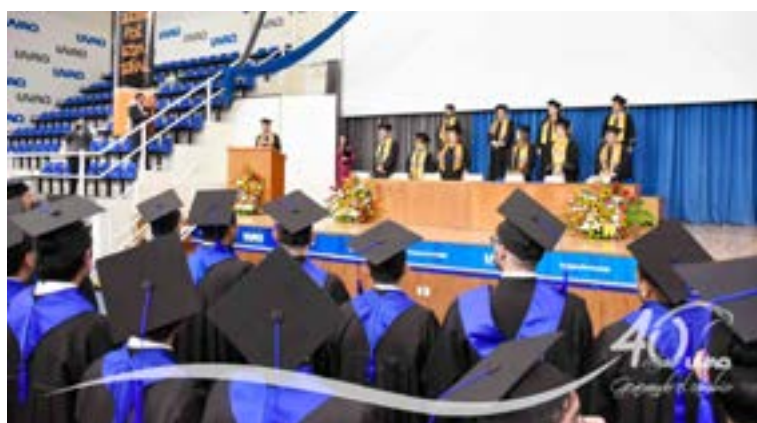
Los egresados escucharon atentos al Rector en su última cátedra.