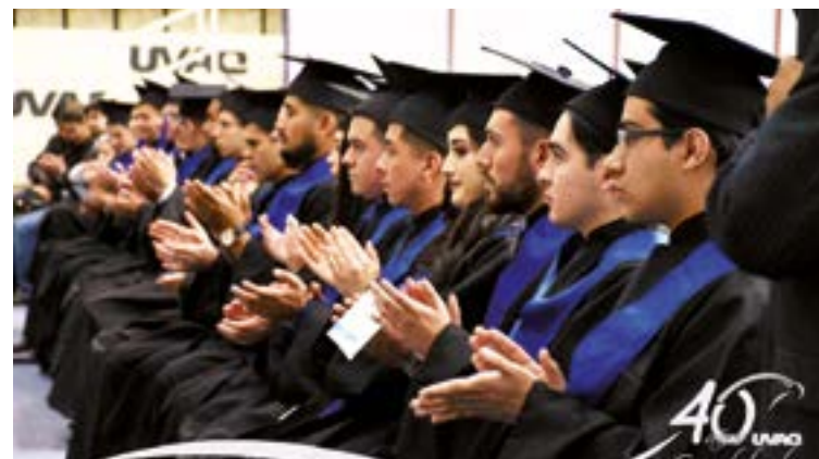
Los graduados se llevaron los aplausos.