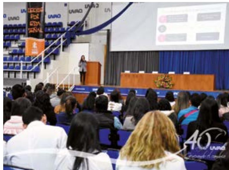
A los eventos de la Escuela de Nutrición asisten estudiantes y egresados.