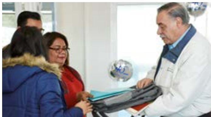
Promotores y directivos de la Unidad Académica en Querétaro se reportan listos para arrancar actividades.

ciados (profesional técnico). Y ofrecemos asociado en Educación Preescolar, Gerencia de Negocios y Artes Culinarias”, comentó la directiva.