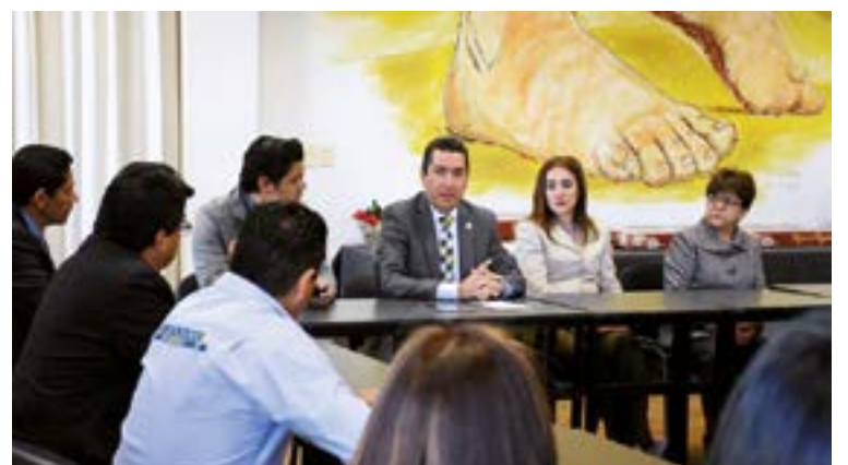
Periodistas y publicistas asistieron al llamado.

La reunión con representantes de medios de comunicación y autoridades académicas fue muy productiva, ya que además de compartir la Rosca de Reyes, algunos de los invitados hicieron varias propuestas para que la UVAQ continúe con su vinculación social, ya sea con especialidades presenciales o a distancia.