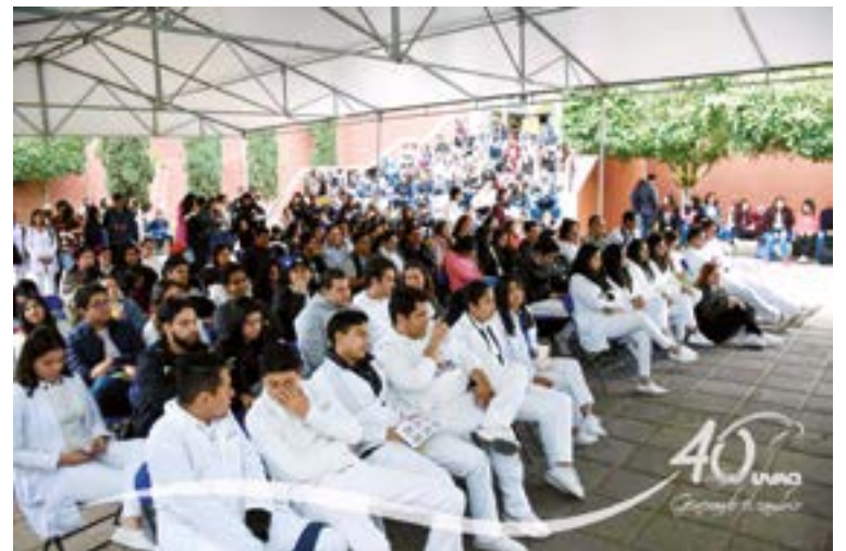
Ya sea como participantes o expectadores, los universitarios se involucran.

El grupo Coffee Break Jazz Trío se presentó con piezas originales de