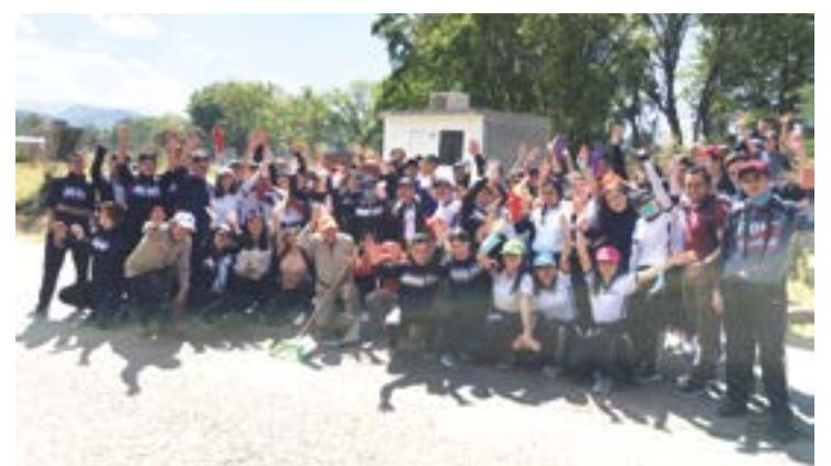
Los estudiantes colaboraron con personal del Ayuntamiento.