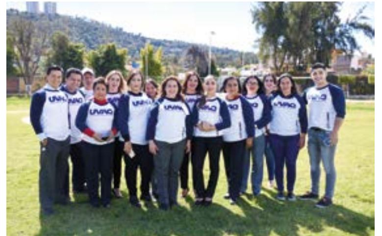
Colaboradores de Ciudad Hidalgo en los eventos de Morelia.

"Sí. Nosotros iniciamos en 1990 en Ciudad Hidalgo y hemos recibido mucho apoyo de la sociedad, sobre todo que ha creído mucho en el proyecto, lo que podemos decir es que cada año crece con nuevas