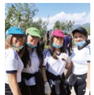
Las chicas de la UVAQ le entraron a la limpieza, con actitud.

parte de la celebración de los 40 años de la Universidad en la localidad, así como un testimonio de que nuestros pequeños esfuerzos sumados a los de otras personas e instituciones pueden incidir directamente en el bien común de la sociedad, como es el caso del cuidado del medio ambiente. A su vez las autoridades municipales agradecieron la participación de la Prepa UVAQ San Diego de Alcalá por su colaboración en esta campaña de limpieza.