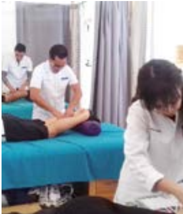
Alumnos de Cultura Física en su práctica de Masoterapia.