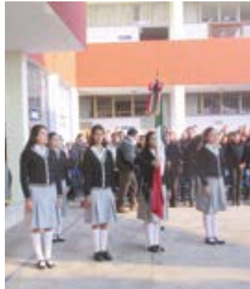
La escolta de la prepa, en el inicio del ciclo escolar.