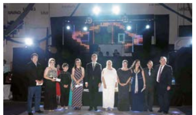
Colaboradores de diferentes áreas llegaron a los 15 años de servicio.