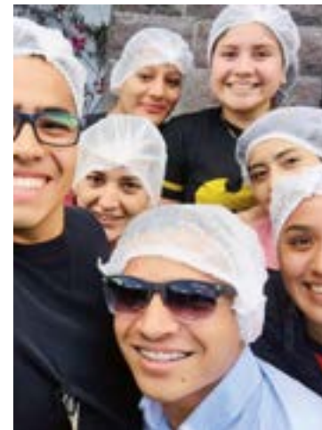
Estudiantes conocieron varias áreas.

-¿Cuántos años tiene la UVAQ en Tacámbaro?