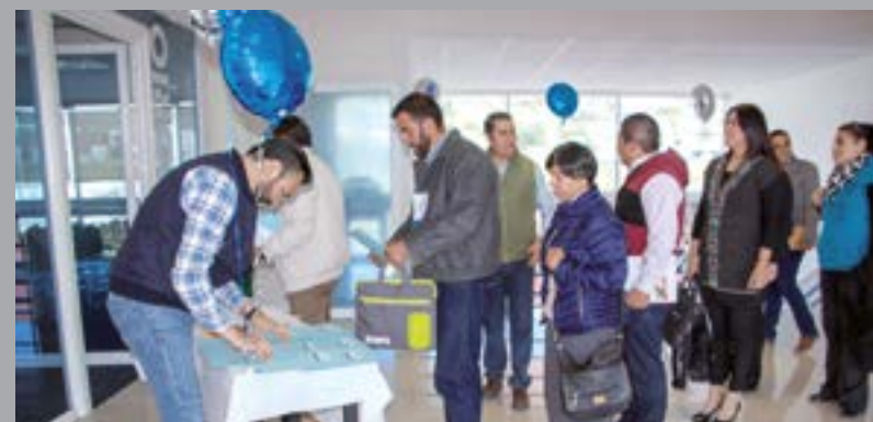
Los invitados llegaron después del Encuentro de Formación Institucional.