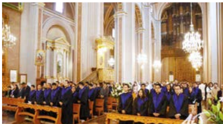
La Misa de Acción de Gracias fue en la Catedral de Morelia.

Egresan nuevos profesionistas de la UVAQ, quienes durante su carrera atesoraron grandes momentos que llevarán siempre en su interior