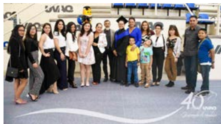
Familias completas asistieron para celebrar el fin de un ciclo.