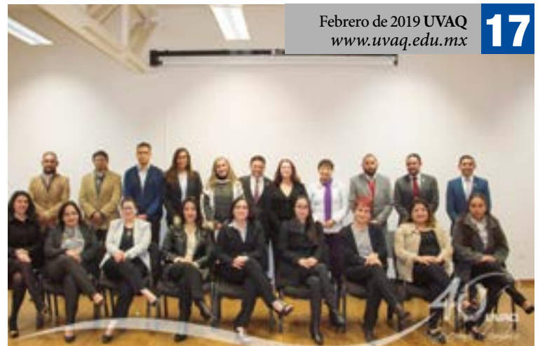
Los docentes de Psicología se presentaron ante directivos de CIFRHS.