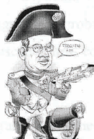
Felipe Calderón Hinojosa Fuente: http://www.worldisround.com/articles/273023/index.html "Felipe napoleón" Autor: McDavid

Nació en Morelia, Michoacán el 18 de agosto de 1962.