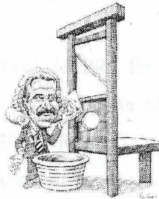
Roberto Madrazo Pintado