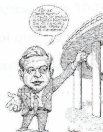
AMLO "segundo piso" Autor: Rocha

Fuente: http://cquick.conacyt.mx/QuickPlace/direccion_de_comunicacion_social/Main.nsf/0/A1220C568046E5C886256F8E004D692D/$FILE/image008.jpg?OpenElement&1106143595