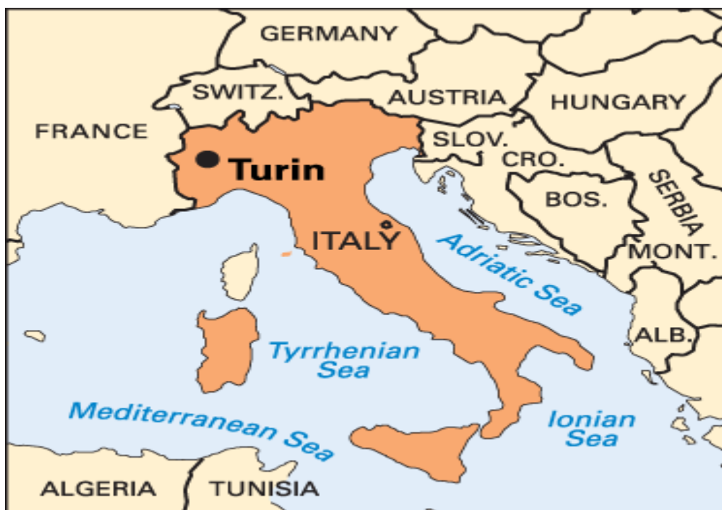
Figura 10. Mapa de la ubicación de Turín.