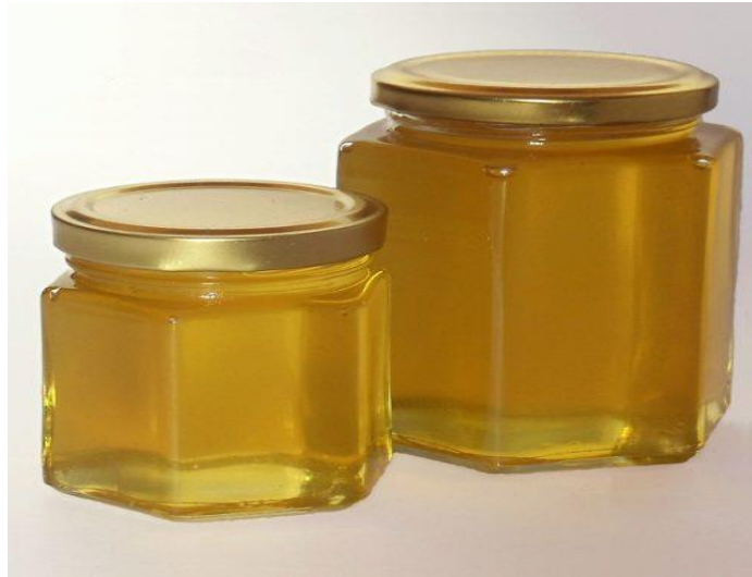
Figura 2. Envase del jugo de maguey

calidad de éste. Además, se tiene que mostrar la información nutrimental, como ingredientes, contenido calórico, azúcares, entre otros y sin olvidar la importante fecha de caducidad para mantener el producto al 100%, como se muestra en la figura 2.