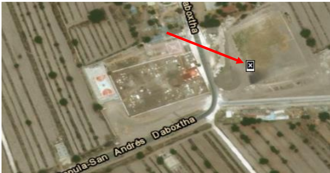
Figura 7. Localización geográfica de la empresa.

La empresa se encuentra en el poblado de San Andrés Daboxtha del municipio del Cardonal en el estado de Hidalgo. San Andrés al ser una localidad bastante pequeña de escasos 1,000 habitantes; la empresa se encuentra en la orilla de la localidad.