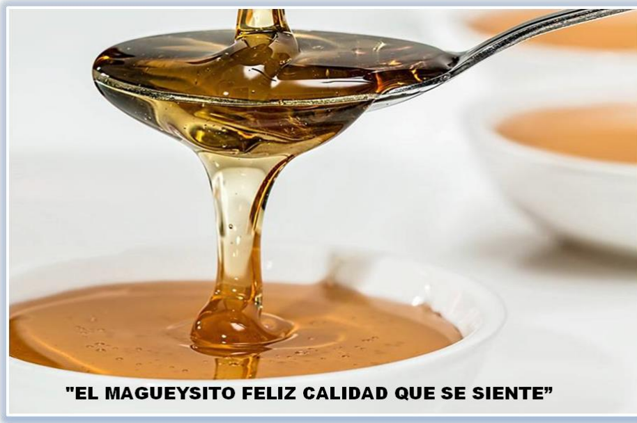
Figura 12. Logotipo de la empresa.