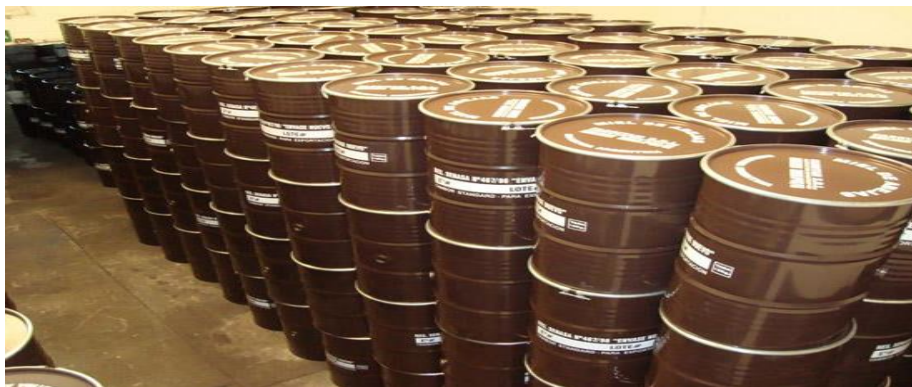
Figura 3. Embalaje del jugo de maguey.

El embalaje es el acondicionamiento de la mercancía para proteger las características y la calidad de los productos que contiene, durante su manipuleo y transporte internacional. El envase es la unidad primaria de protección de la mercancía, la cual es acondicionada luego dentro del embalaje.