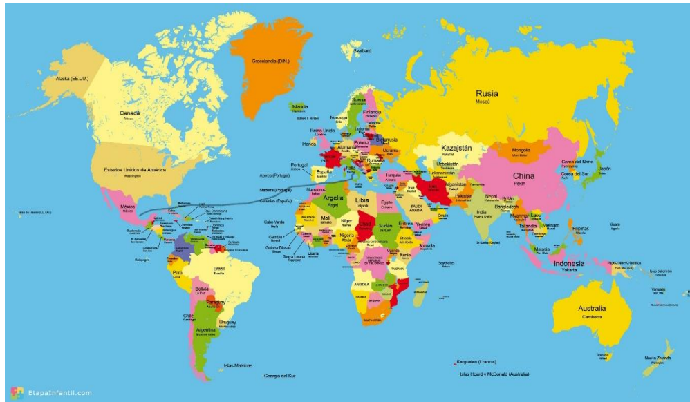
Figura 9. Ruta de macro localización