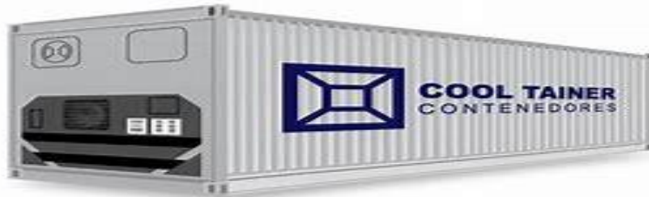
Figura 4. Imagen del contenedor refrigerado.

Para el uso industrial y comercial de la miel de maguey, el producto debe almacenarse o transportarse en tambores de metal de 150 o 300 kg., que estén revestidos en el interior de barniz protector especial para el manejo de alimentos o cubos de 25 -30 kg., de lata de acero cromado, aluminio o plástico. Para el transporte de botellas individuales, se utilizarán cajas de cartón de 12 piezas, con rejillas de cartón en el interior para proteger los envases de vidrio y con la leyenda en el exterior Frágil vidrio . Se estima se puedan ubicar hasta 168 cajas en una tarima de 1.20 por 1.20 metros, con un peso aproximado de una tonelada.