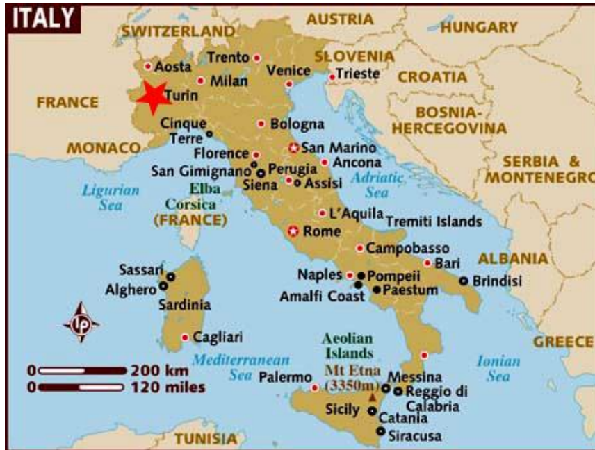
Figura 6. Mapa de Italia

todo y que Torino va a ritmo pausado, posee los ingredientes de una urbe de lo más vibrante.