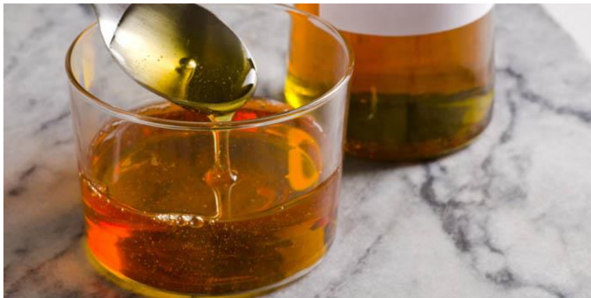
Figura 1. Jarabe de maguey.

Una vez alcanzado el punto de miel se deja reposar por varias horas hasta que esté totalmente fría para proceder al envasado, cuyos recipientes que serán utilizados para colocar la miel de agave, deben ser previamente esterilizados para que garanticen la frescura, calidad, naturalidad del producto. Disponer el producto a los clientes a su consumo por medio de los canales de distribución establecidos para la facilidad de alcance de el producto al cliente, producto el cual puede consumirse de varias maneras, dependiendo el uso que se dé y la necesidad del consumidor.