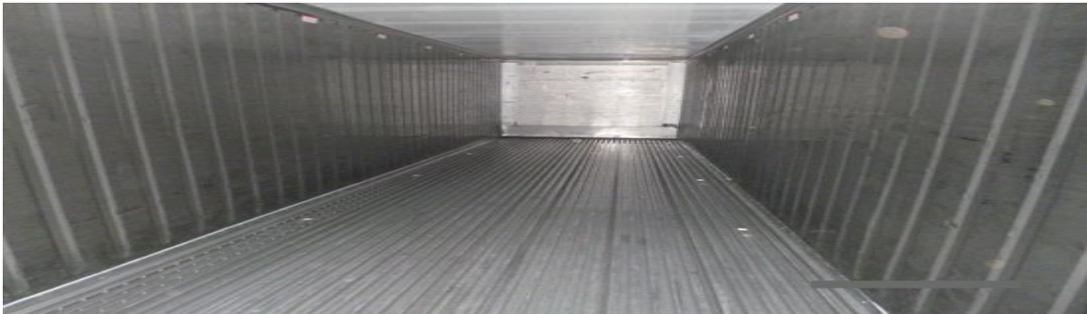
Figura 5. Interior del contenedor refrigerado