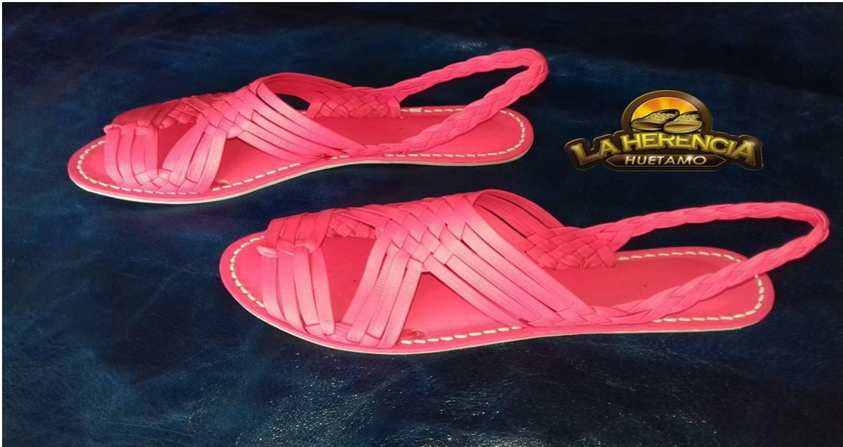
Figura 5. Presentación para la venta del huarache