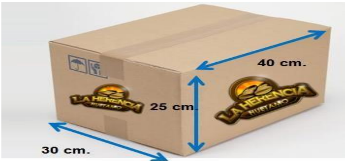
Figura 6. Caja de embalaje