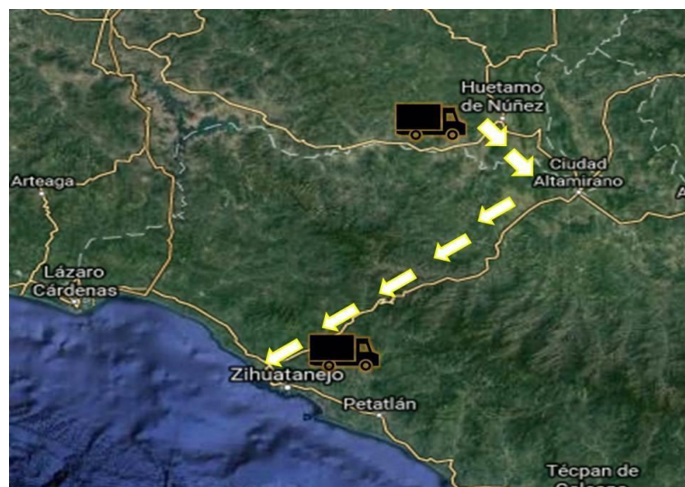
Figura 2. Trayecto en camión