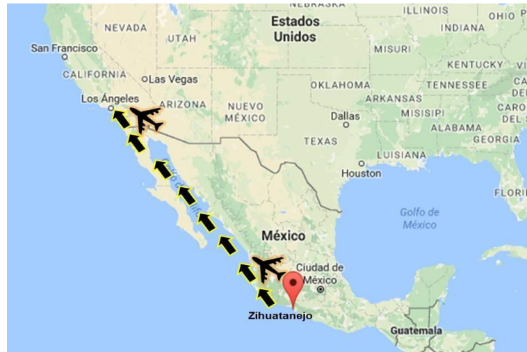
Figura 3. Trayecto en avión