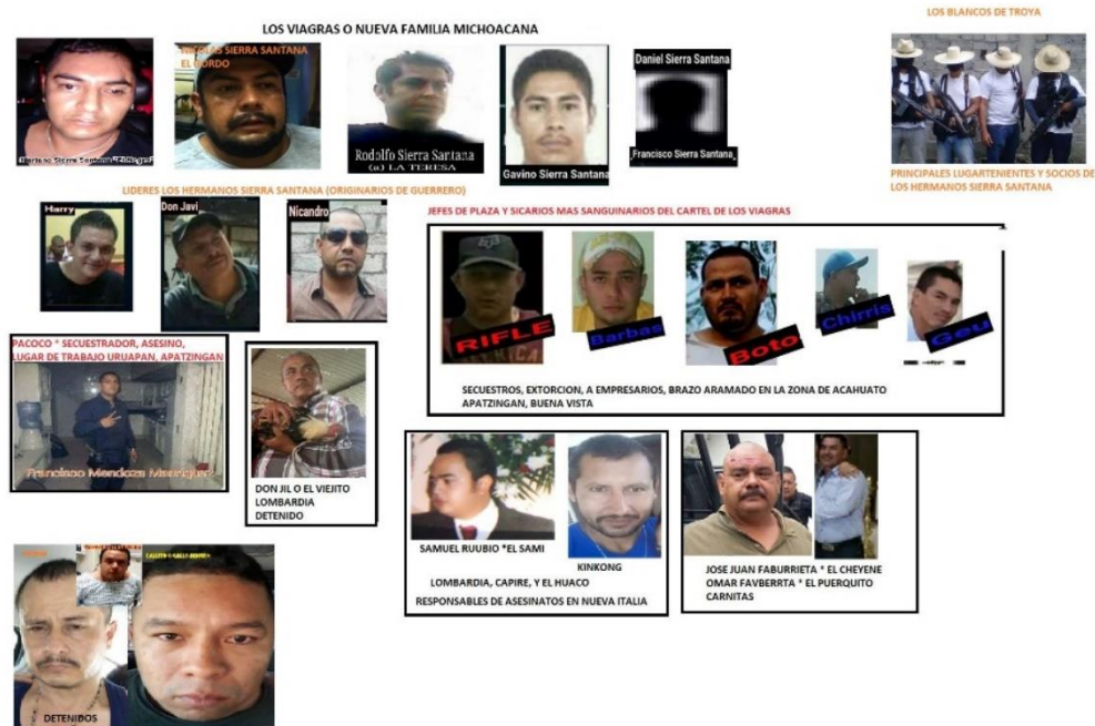
Ilustración 4. Estructura Los Viagras y Cartel la Nueva Familia Michoacana 4

En la región de tierra caliente por el lado de Apatzingán se encuentra el grupo delictivo de Los Viagras.