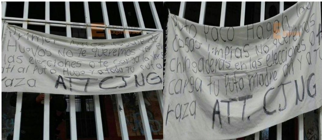
Ilustración 5. Intervención de la delincuencia organizada en las elecciones 5

En el año 2009, el líder delincencial de Los Caballeros Templarios Saúl Solís Solís es nombrado el candidato para contender en el proceso electoral al cargo de diputado federal por el distrito electoral número 22 con asiento en Música Michoacán, mismo que recibió financiamiento del cartel de Los Caballeros Templarios.