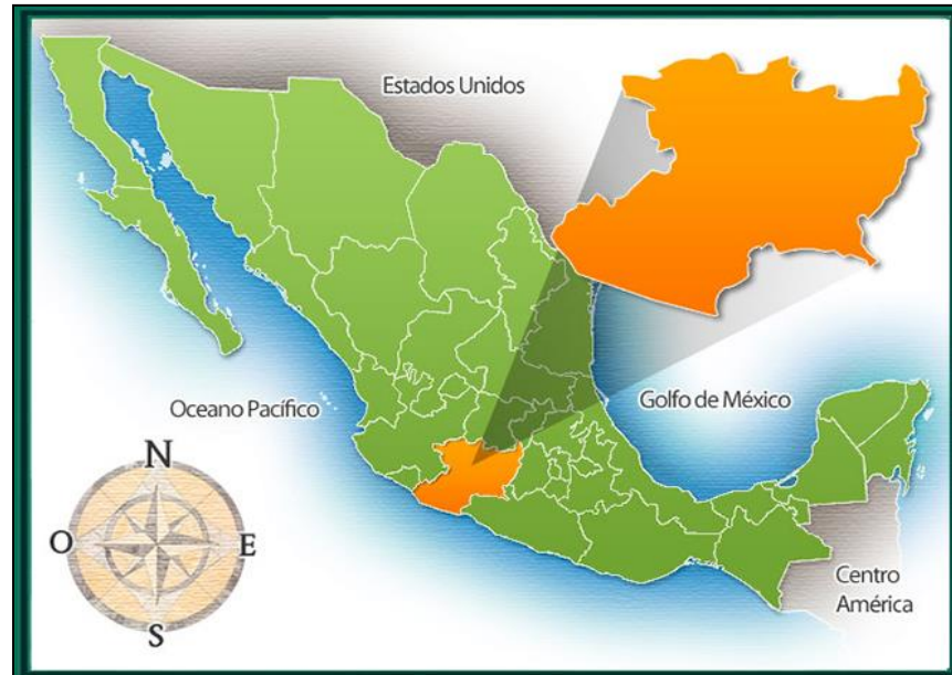
Ilustración 1. Ubicación del Estado de Michoacán 1

grandes de México y América Latina, el puerto de Lázaro Cárdenas (Estado de Michoacán de Ocampo - Para todo México, s.f.) ( Ilustración 1 )