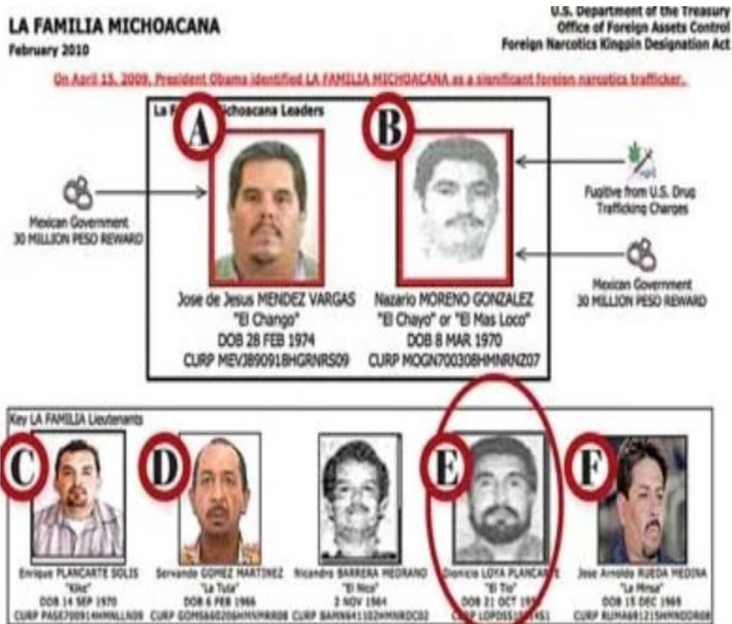
Ilustración 3. Estructura Cartel La Familia Michoacana 3

Así mismo, en el lado opuesto en la región oriente y parte de la sierra alta de Ciudad Hidalgo, se encuentra “La Familia Michoacana” (LFM) en Zitácuaro, Benito Juárez, Tuzantla, Susupuato, hasta Tiquicheo.