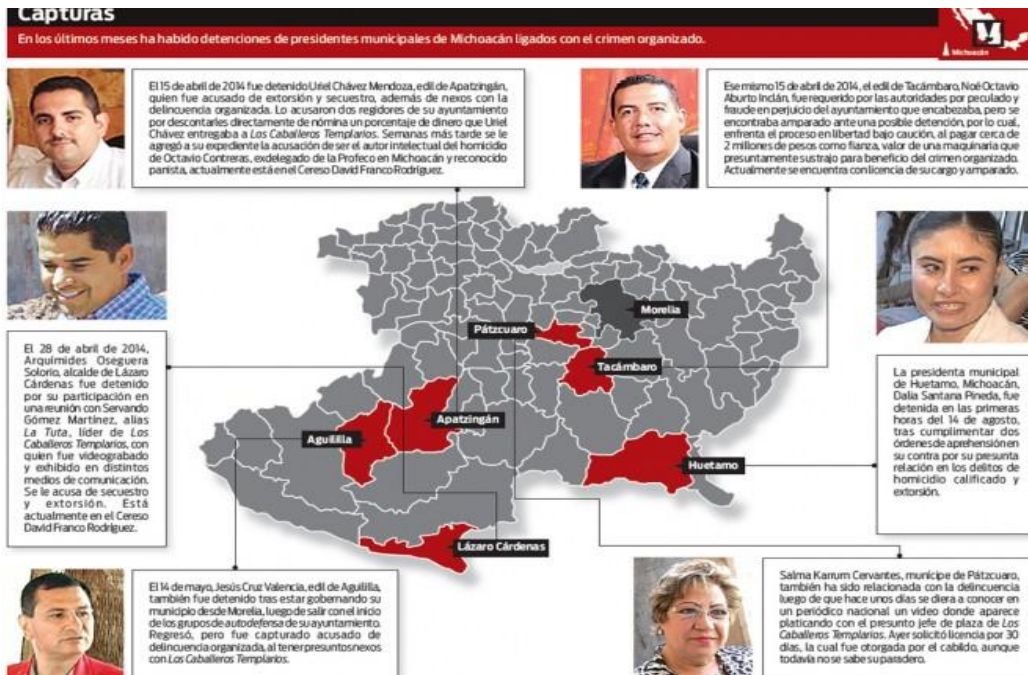
Ilustración 8. Políticos detenidos por estar presuntamente relacionados con la delincuencia organizada 8

En el proceso electoral llevado a cabo en el año 2015 en esta entidad federativa, el candidato a gobernador de esta entidad federativa por el PRD, PT y ALIANZA, se vio relacionado en acusaciones que los otros actores y partidos políticos hablaron en su contra, ya que se le acusaba de tener vínculos con el líder de Los Caballeros Templarios, Servando Gómez Martínez alias “la Tuta”, debido a que se le señalaba de haber recibido importantes cantidades de dinero y el apoyo de este grupo de delincuencia organizada para incidir en el proceso electoral, reforzar su campaña y afianzarlo como triunfador de junio del 2015 y a cambio de ello tendría que continuar brindando protección al grupo de Los Caballeros Templarios. De estos hechos se inició una averiguación previa penal en la entonces Procuraduría General de