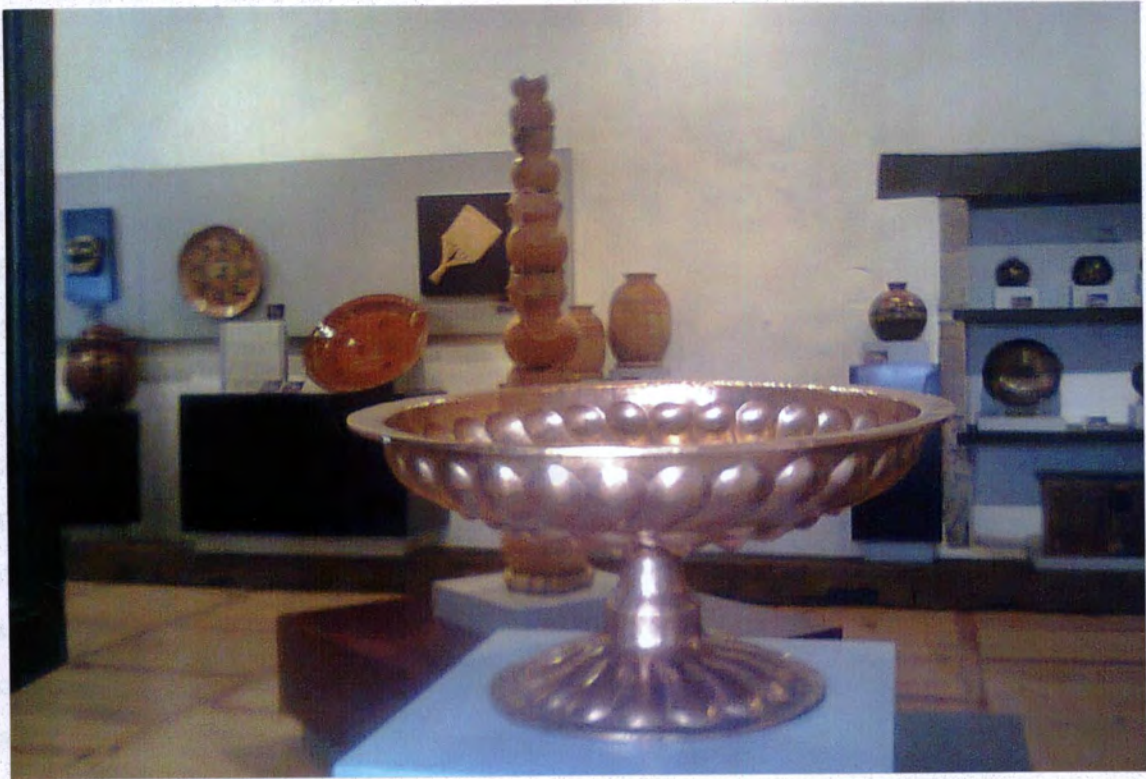
En sus ritos del momento de la feria de San Juan, el agua se purifica con el uso de la chalice de plata, la cual se utiliza para purificar el agua que se utiliza para beber.