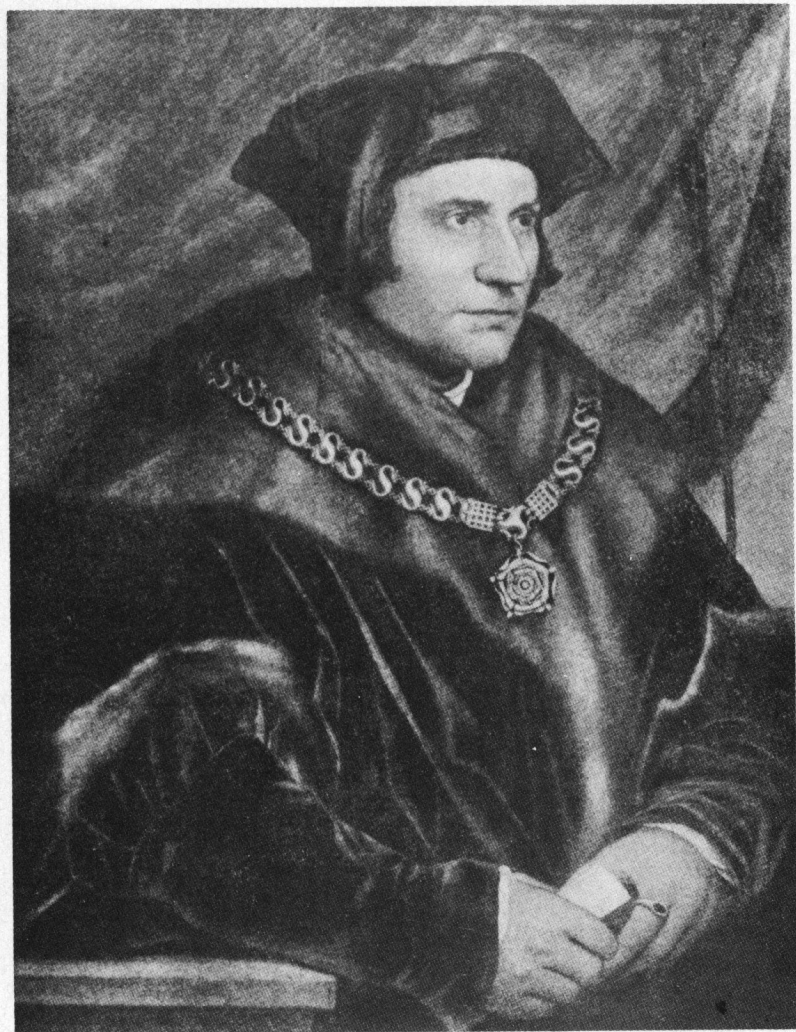
Retrato de Thomas More, por Hans Holbein (1527). Frick Collection, New York.