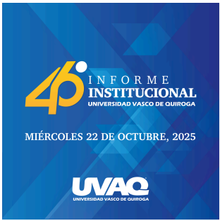
TRANSMISIÓN EN VIVO