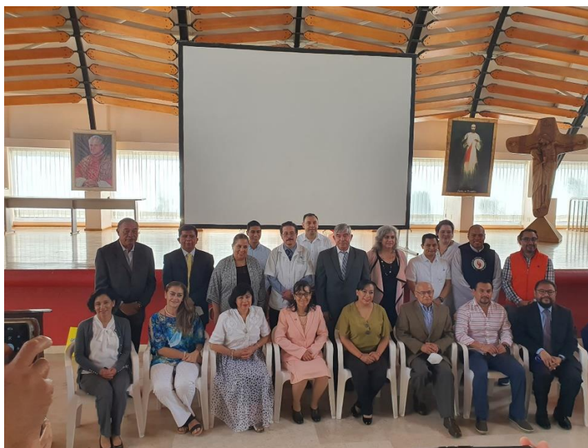
Primera Generación en Querétaro