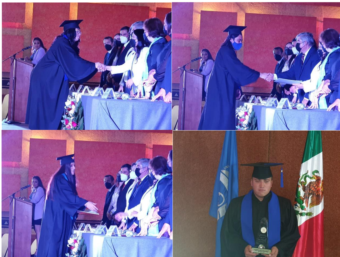
Los mejores promedios y nuestro alumno con su Medalla al Mérito