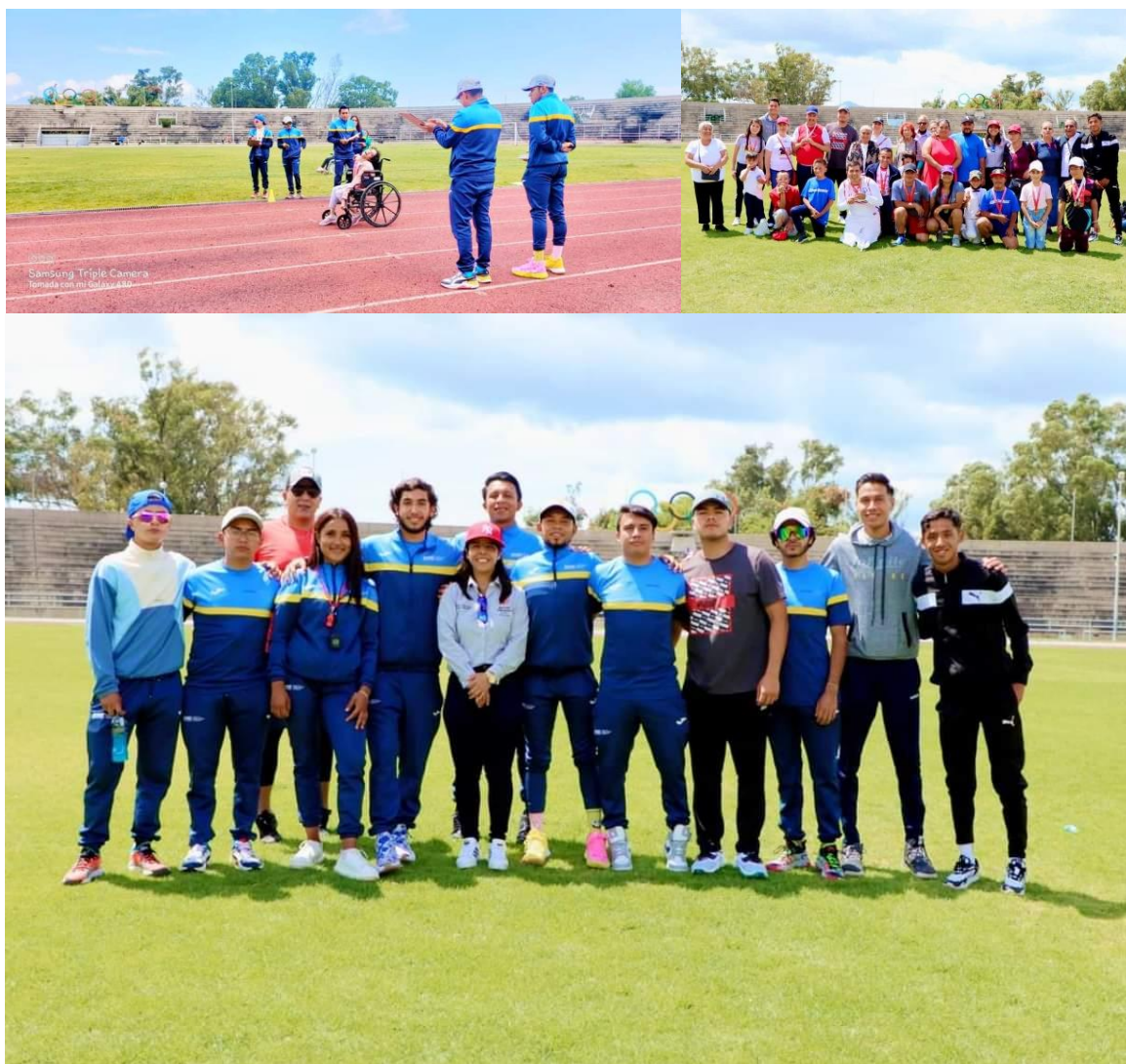
Nuestros alumnos de Ciudad Hidalgo en la grama del Venustiano Carranza

Nuestros alumnos de la Licenciatura en Cultura Física y Deporte del sexto cuatrimestre participaron dentro de los Juegos Estatales de Verano 2022 que se realizaron en el Estadio Olímpico “Venustiano Carranza” de la ciudad de Morelia; en el marco de la asignatura Deporte Adaptado de Competencia se desempeñaron como entrenadores de Bochas y Atletismo, como jueces principales de bochas, lanzamiento de bala y salto de longitud, así como cronometristas en las distintas pruebas de atletismo en pista mostrando el compromiso social y el profesionalismo propio de la comunidad UVAQ.