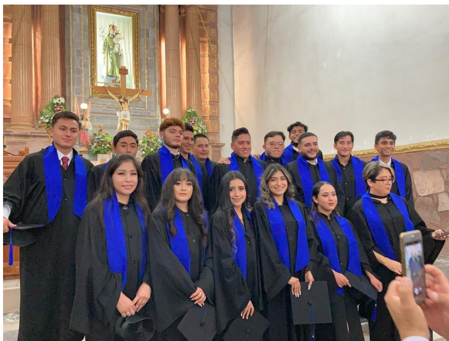
Alumnos de Cultura Física y Deporte