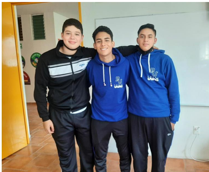
Los triple E