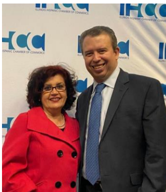
Pedro Martínez: Director Ejecutivo de las Escuelas Públicas de Chicago