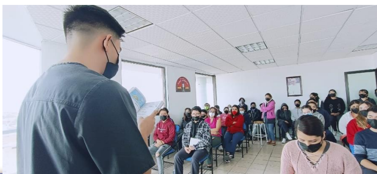
UVAQ San Luis Potosí

En todas nuestras Unidades Académicas se vivió con devoción el inicio de la cuaresma con la imposición de la ceniza y recordar que “polvo somos y en polvo nos convertiremos”.