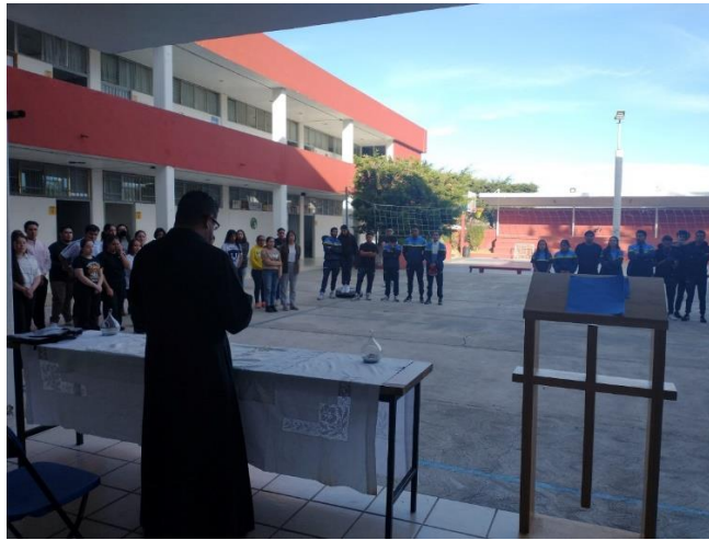
UVAQ Ciudad Hidalgo