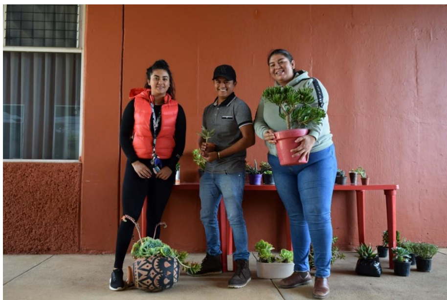
Las tres plantas con mejor cuidado

En esta misma Unidad los alumnos continúan con sus prácticas de campo , en este caso los de 5º semestre realizaron una colecta de insectos en la Unidad para la materia de Entomología Agrícola. Los de 7º hicieron un muestreo en proyecto de investigación en aplicación de Micorriza IAB-60 para la obtención de datos, muestreo al azar de los diferentes tratamientos y medición de alturas.