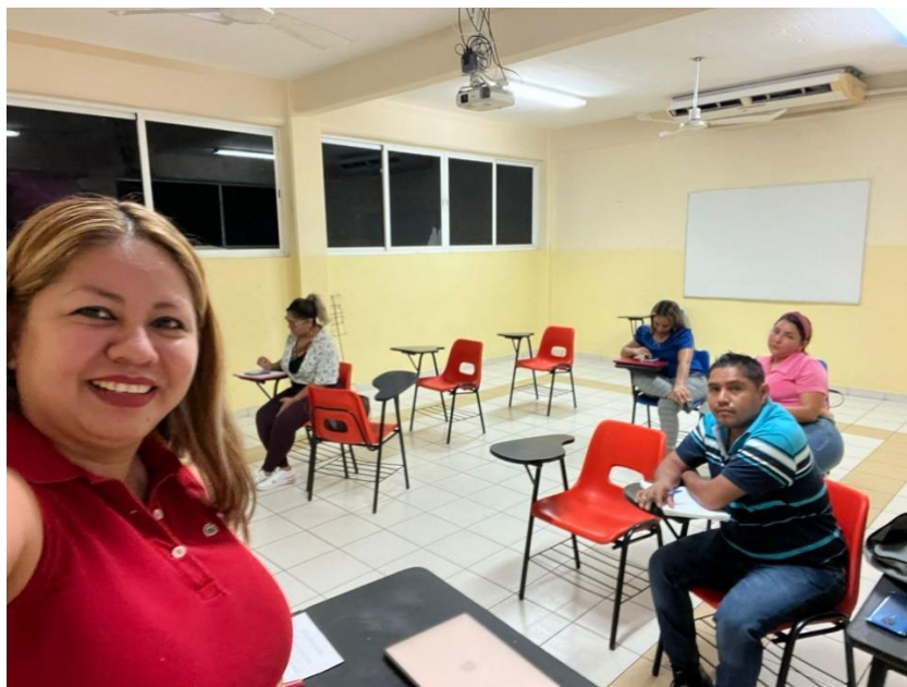
Diplomado en Comercio Internacional