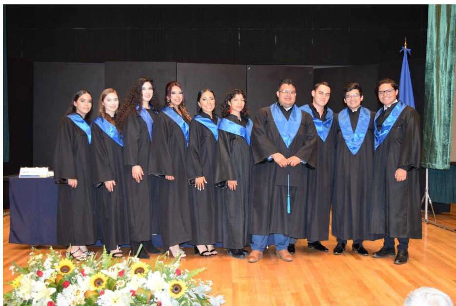
Sexta generación de Ingeniería en Innovación