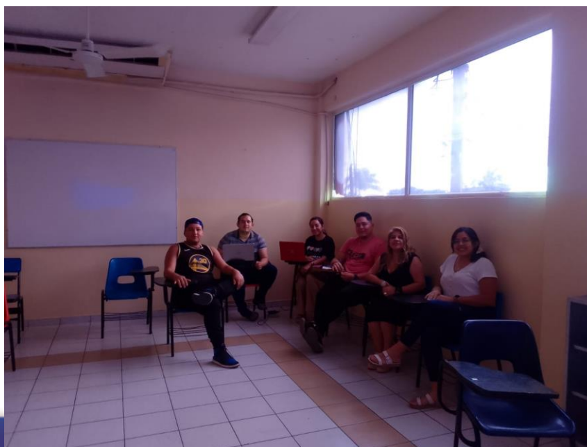
Diplomado en Negocios y Marketing

En UVAQ Lázaro Cárdenas siguen en marcha sus dos diplomados en Desarrollo de Negocios y Marketing Digital y el de Comercio Internacional y Negocios como parte de su oferta de Educación Continua en este verano y un total de 10 inscritos.