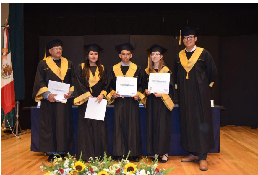
Primera generación, Maestría en Nutrición Vegetal