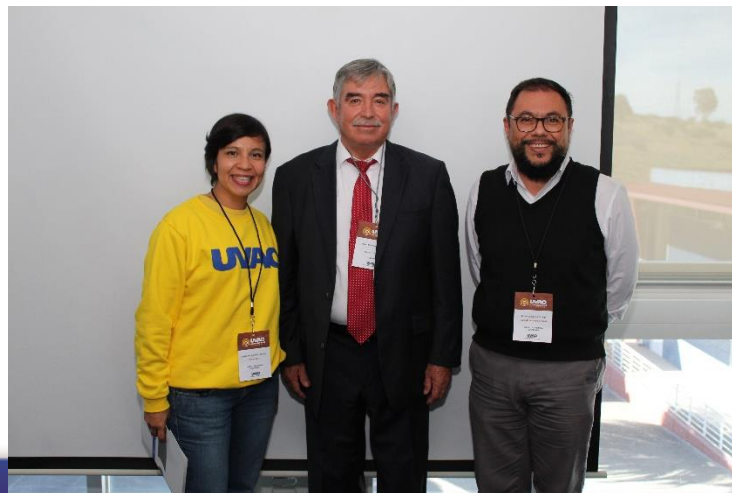
UVAQ Querétaro también se tomó la del recuerdo