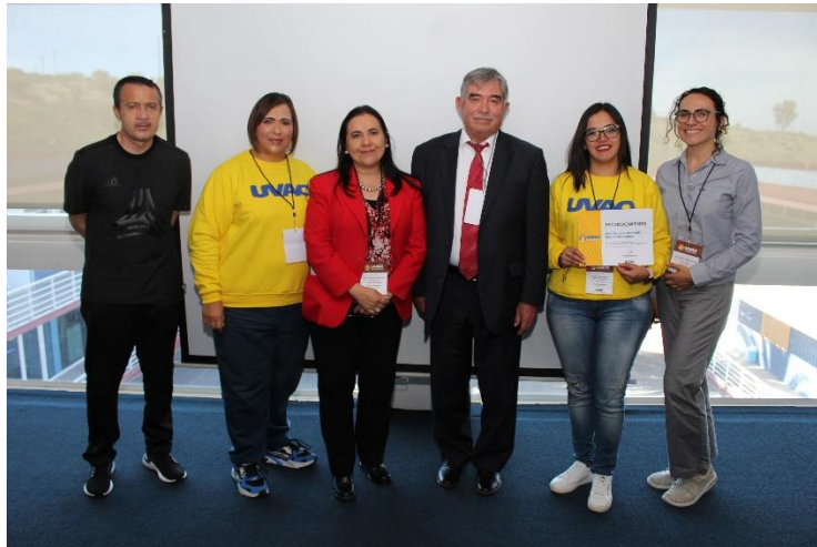
Nuestros compañeros de Ciudad Hidalgo en la foto con el Rector General