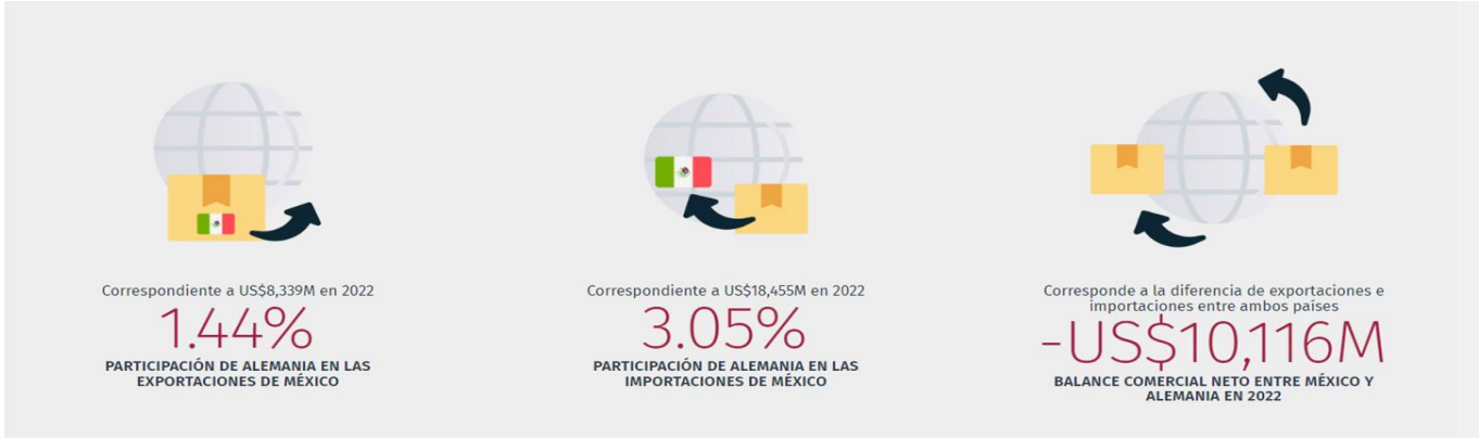
Ilustración 1 Participación de Alemania en México 2022