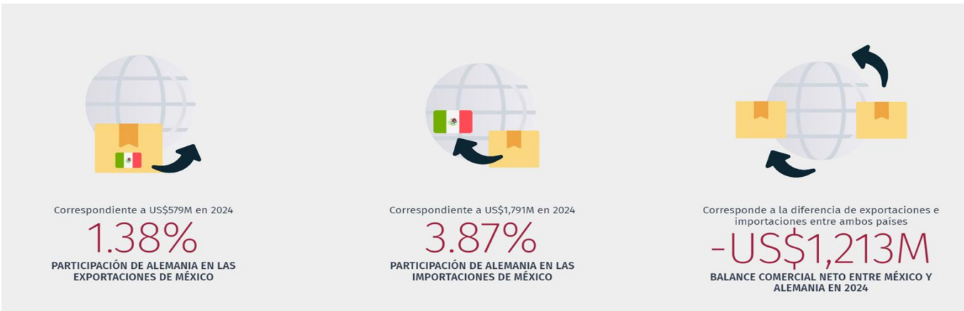
Ilustración 3 Participación de Alemania en México 2024