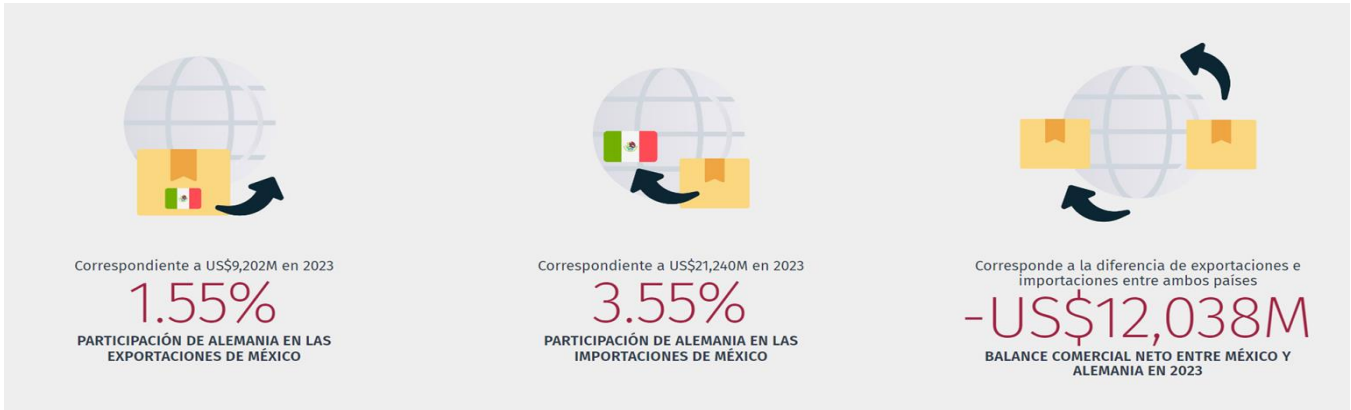
Ilustración 2 Participación de Alemania en México 2023